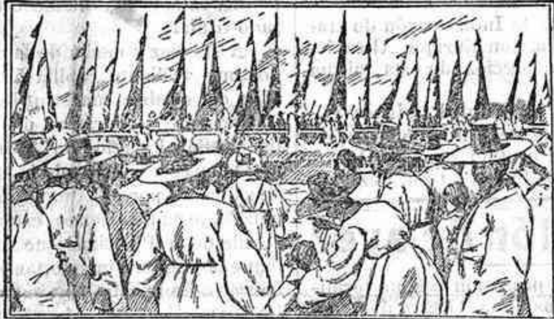
El rey de Corea dirigiéndose procesionalmente á una fiesta religiosa

El poderoso y progresivo imperio de Oriente se dispone á recoger en breve uno de los más apetecidos y provechosos frutos de sus victorias de 1894 sobre China y de las que obtuvo peleando contra Rusia en las campañas de 1904 y 1905.