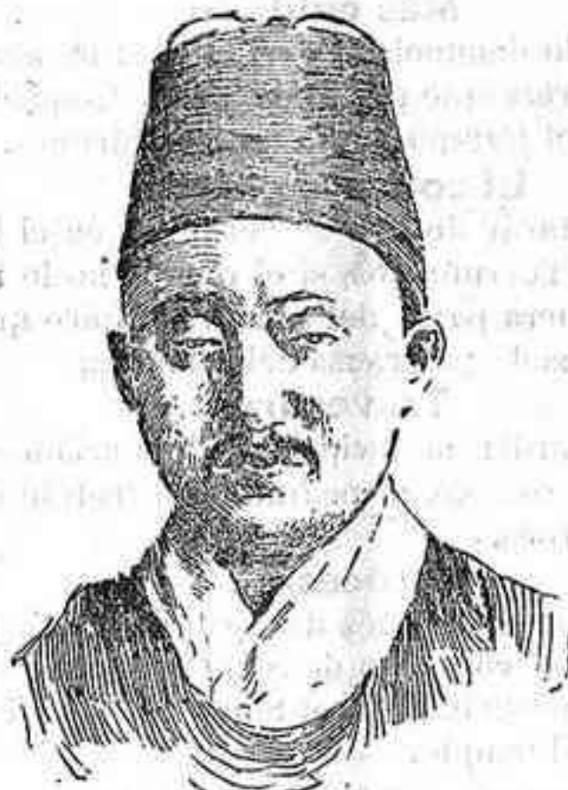
Gy Hyeung, rey de Corea.

Según se afirma en los círculos diplomáticos, está muy próximo el hecho de la anexión de Corea al imperio del Sol Naciente, asegurando los que se tienen por bien enterados que aquella se llevará á efecto antes de Agosto, mes en que han de principiar á regir los nuevos tratados de comercio que sucederán á los que caducan en Julio, y en los cuales figurará la frase: «El Japón y la provincia incorporada de Corea.»