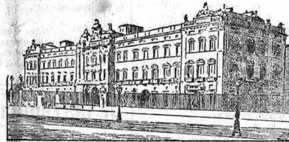
Palacio de Buckingham, residencia real en Londres de los Soberanos de Inglaterra.