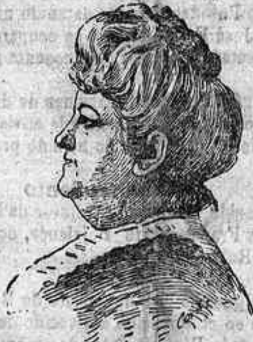
La condesa de Pardo Bazán

Los «trata» escolares de Nueva York escaban de otorgar a la ilustre escritora doña Emilia Pardo Bazán una estimadísima distinción: la gran medalla de oro, primer premio de Literatura y Arte.