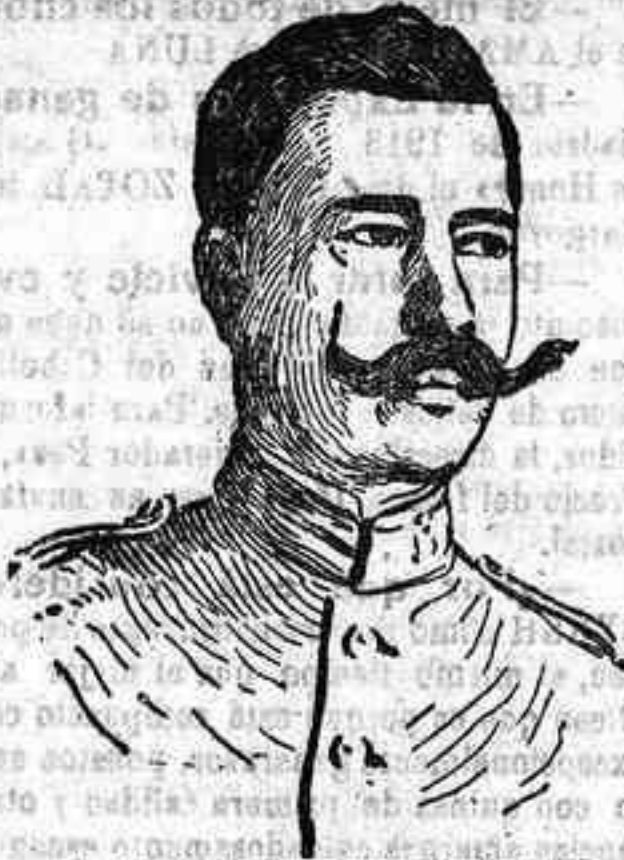
El coronel Fernández Silvestre, comandante general de Larache.

Una vez más nuestros soldados han sido villanamente agredidos por el montañés marroquí. Varios de ellos han sucumbido víctimas del plomo de los adversarios; otros más quedaron mal heridos.