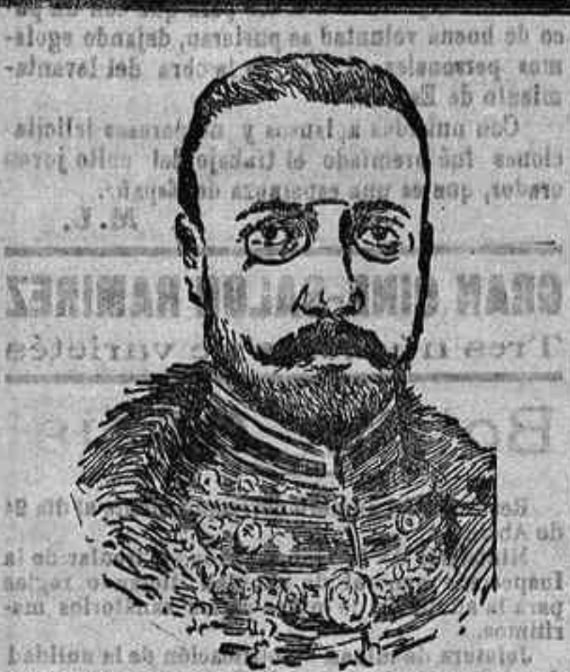
FIGURAS DEL DIA.—El Barón Burián, sustituto del conde Czernin en el ministerio de Negocios extranjeros de Austria Hungría.

Al capitán del regimiento de la Reina don Emeterio Ortega Forriola se le ha concedido permiso.