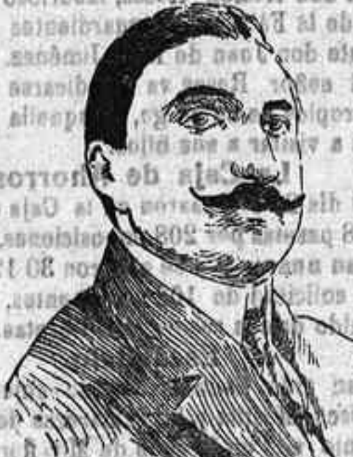
Duque de Montpensier

Lo de autónomo... pasar; pero en cuanto a independiente, el tiempo y los hechos lo dirán.