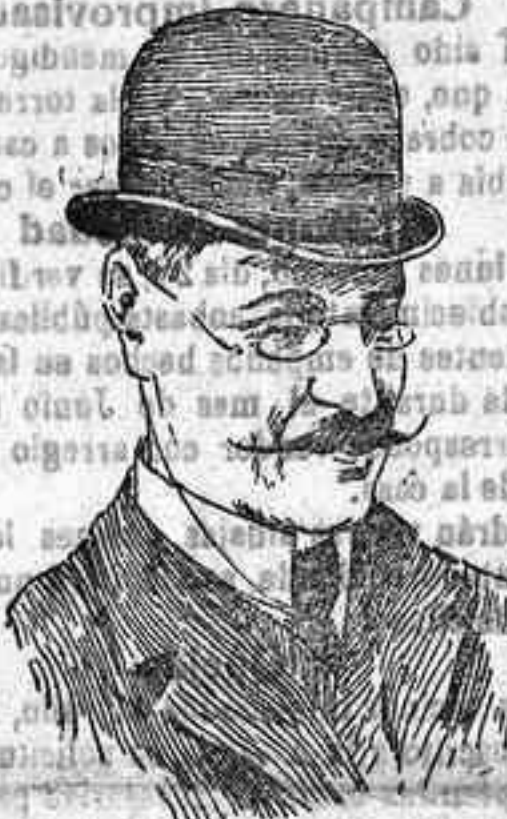
Príncipe Alberto de Wurtemberg

Hablemos, pues, solamente de un pleito entablado en la sombra entre cuatro personalidades de elevada alcurnia.