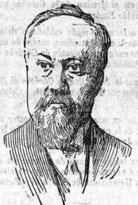
El Sr. Raimundo Poincaré, que se ha posesionado del cargo de presidente de Francia.