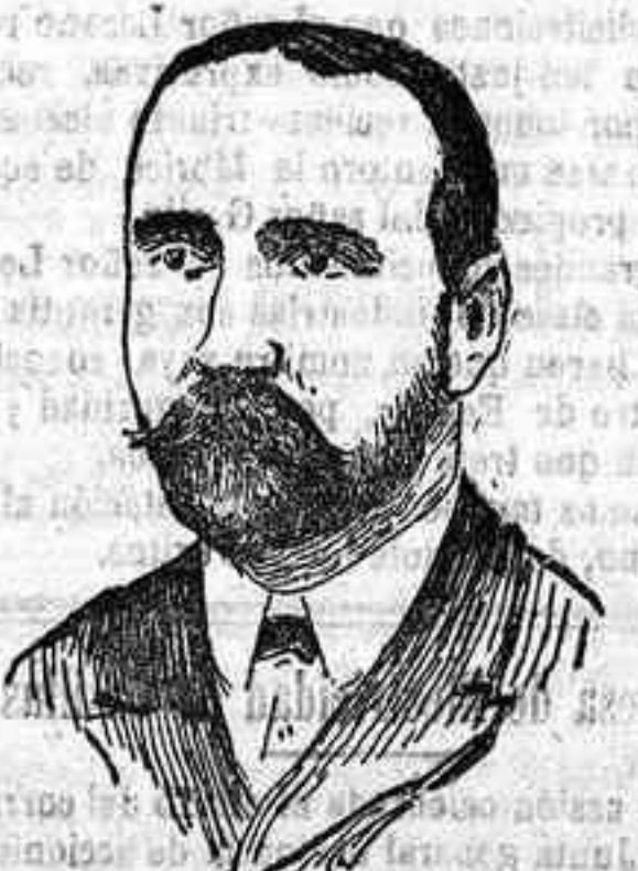
El Dr. Madero, presidente de la República de Méjico, que ha sido hecho prisionero por las fuerzas del general Blanquet.

Sociedad anónima minera San José. —Anuncio relativo al pago de las obligaciones.