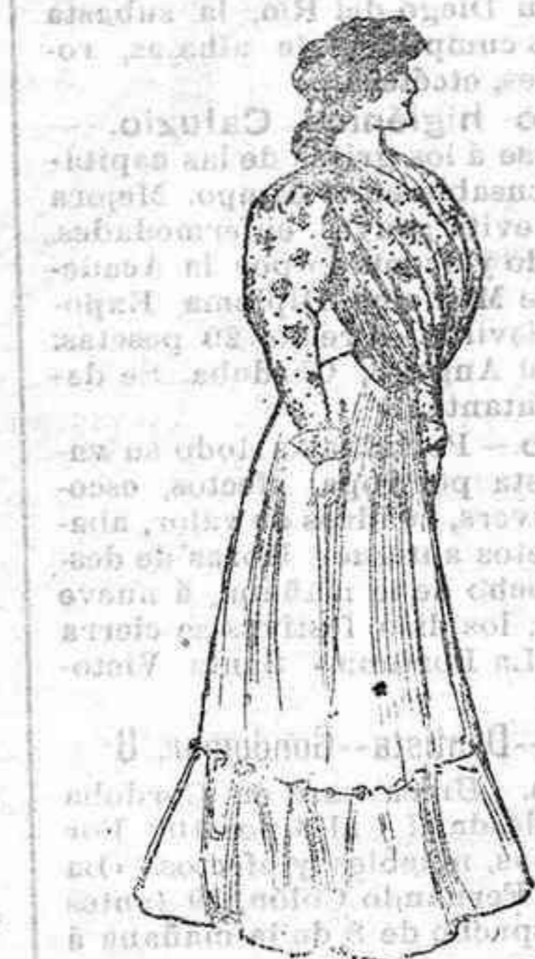
Chaqueta para casa

Empléanse para ella elegantes telas de batista, que este año, bautizadas con nuevos nombres por el comercio, ofrecen más variedades que nunca, preciosas algunas de ellas.