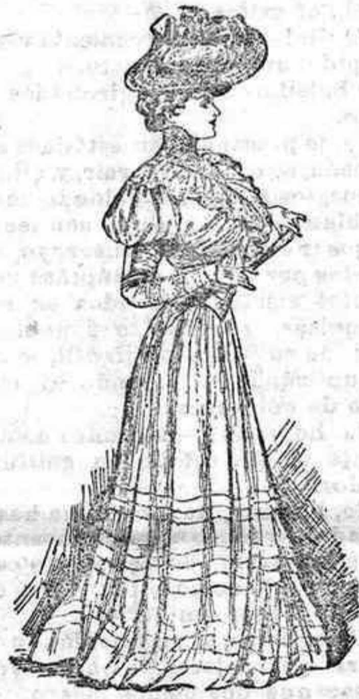
Traje de mañana propio para señoritas y señoras jóvenes

Cuerpo y falda de color claro; el primero, como se ve, es de mucha fantasía, por la excelente disposición de sus adornos y el acierto con que se colocan.