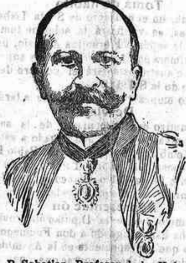
P. Sabatier, Profesor de la Universidad de Tolosa, premio de Química