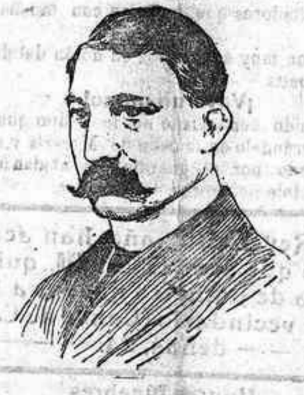
V. Grignard, profesor de la Universidad de Nancy, premio de Química