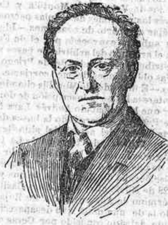
Gerardo Hauptmann, célebre poeta y dramaturgo alemán, premio de Literatura

Con la solemnidad y la forma de otros años, el rey de Suecia ha hecho entrega de sus premios, unas 195 000 pesetas cada uno, y sus medallas de oro, a las cinco ilustres personalidades a quienes este año ha sido otorgado el premio Nobel.