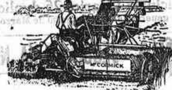
Afadoras Macormick — ULTIMA PERFECCION —