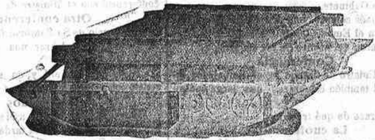
TRILLO ROTATIVO DE GRAN TRABAJO para una sola yunta de mulos.