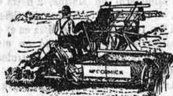
Atadoras Macormick — ÚLTIMA PERFECCION —