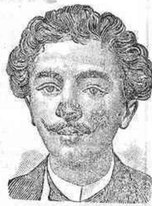
Antes de la curación.