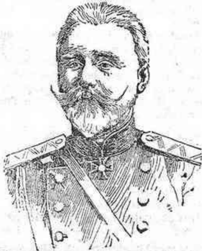
El nuevo ministro de la Guerra ruso general Polivanof.

La proporción de la población verdaderamente rusa en el Imperio ruso, es sólo de un 43 por 100; y si además se tiene en cuenta que entre este 43 por 100 de rusos existe también un gran descuento por las condiciones políticas actuales, cabe suponer que un resultado desgraciado de esta guerra podría acarrear una verdadera catástrofe al poderoso Imperio moscovita.