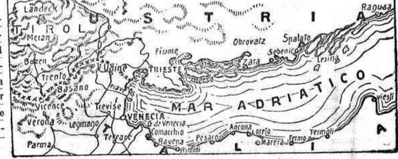
Gráfico de las fronteras austroitalianas y puertos del Adriático que serán teatros de la lucha, de estallar la guerra entre Austria e Italia.

hacer oposiciones a plazas de profesores numerarios de las Escuelas Normales.