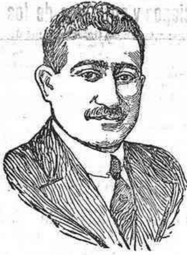
Federico Moreno Torroba, joven e inspirado compositor, que sigue obteniendo grandes éxitos con su obra musical «Cuadras».