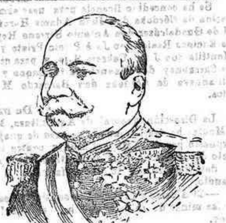
El general don Ramón Franch y Trasserra, que ha pasado, por la edad reglamentaria, a la primera reserva.

El detenido fué puesto a la disposición del Juzgado.