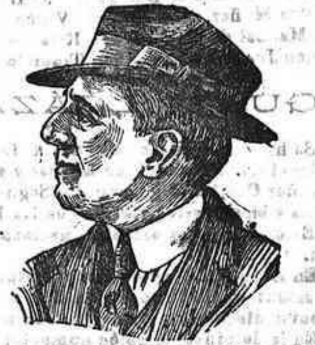
Don Eduardo Sánchez Fuentes, distinguido maestro compositor cubano que se halla en Madrid con el fin de estrenar una de sus últimas composiciones.