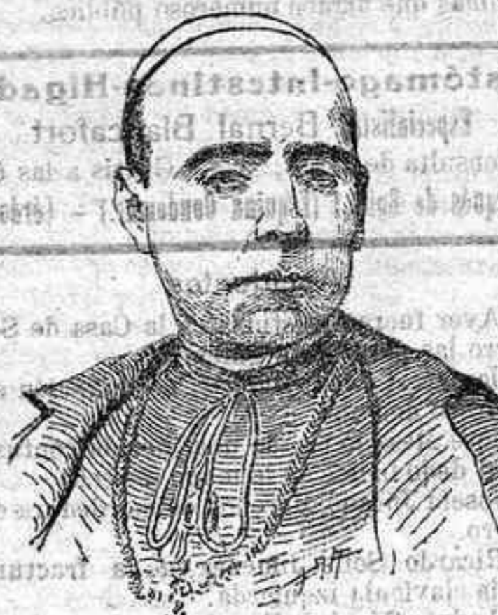
El Cardenal Guisasola

El eminentísimo señor don Victoriano Guisasola y Menéndez nació en Oviedo el 21 de Abril de 1852. Contaba, por lo tanto, sesenta y ocho años. —Recibió las sagradas órdenes en Ocaña, de manos de su tío don Victoriano Menéndez, en aquel entonces obispo de Teruel, y más tarde de la Metropolitana de Santiago de Compostela. —En día primero de Enero de 1877 celebró por vez primera el santo sacrificio de la misa en la Iglesia de Montserrat, de la Corte. A la muerte de su tío, el Cabildo Catedral de Santiago de Compostela le designó vicario capitular, y ya en este cargo dió muestras de celo y exquisito tacto, que había de ser su especial característica en el desempeño de las funciones episcopales. En 1893 ingresó en la prelaturo, siendo consagrado obispo de Osma, rigniendo después la diócesis de Jaén, en 1897, y la de Madrid-Alcalá, en 1901. En 1905 fué elevado a la dignidad de arzobispo, y en 1906 pasó a regir las archidiócesis de Valencia, hasta su exaltación a la Sede primada, en 1913, por fallecimiento del eminentísimo señor cardenal fray Gregorio María Aguirre. En 25 de Mayo de 1914 fué nombrado cardenal, y dos días más tarde le fué impuesta la birreta cardenalicia.