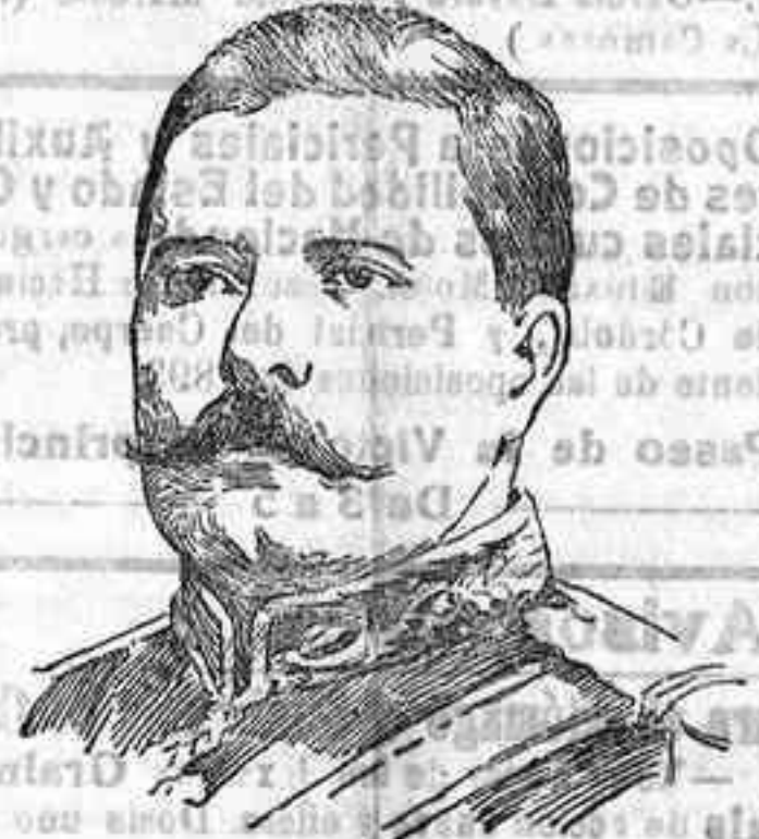
El general mejicano Félix Díaz, a quien se indica para ocupar el cargo de presidente provisional de México

Los juegos de trilla RUSTON son completos, llevando, si se desea, elevador de paja.