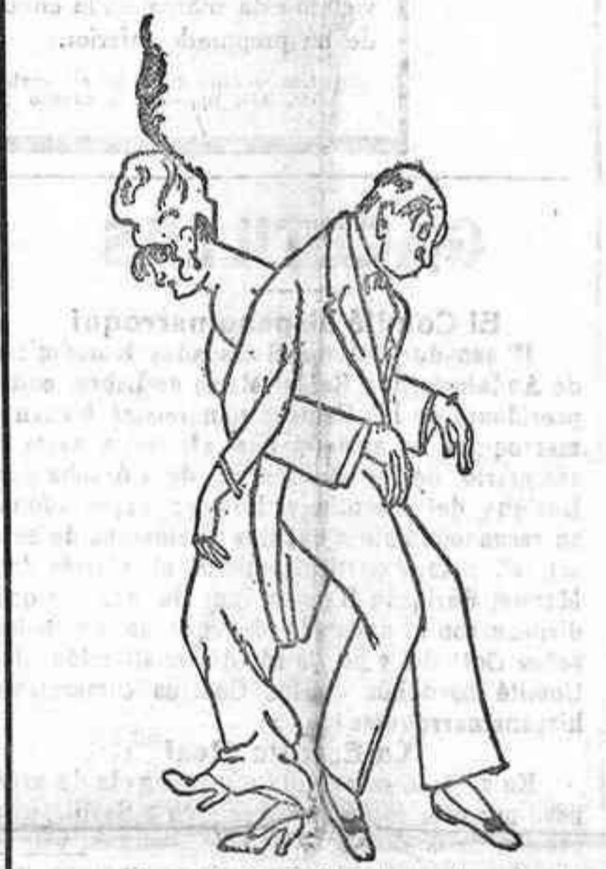
Como bailarían los elegantes el tango argentino, en vista de las recriminaciones lanzadas contra esta danza.

Parque de Intendencia de Córdoba.—Anuncio del concurso que celebrará el 5 de Febrero para adquirir artículos de consumo.