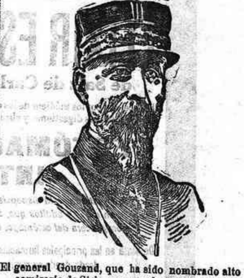
El general Gouzan, que ha sido nombrado alto comisario de Siria, con mando en jefe del ejército francés.