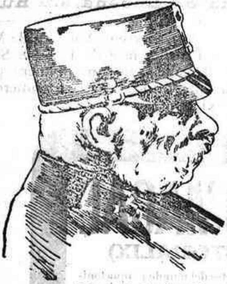
El último retrato del emperador Francisco José.