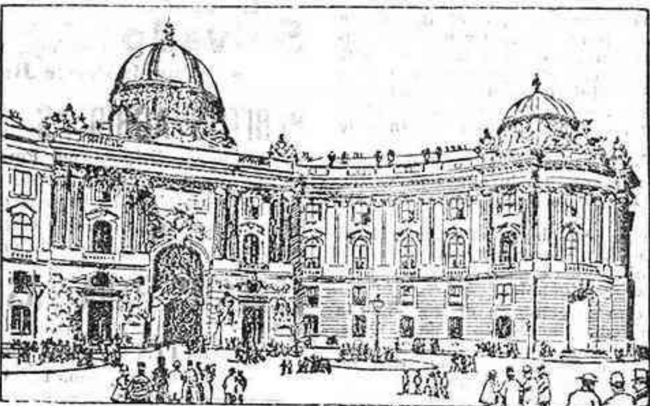
El palacio de Schönbrunn, residencia habitual de Francisco José, y en el cual ha fallecido.

No fué este el único atentado que sufrió Francisco José: en 1853 paseaba, por los jardines de Viena cuando un individuo se arrojó sobre él, echillo en mano, hiriéndole gravemente en la nuca.