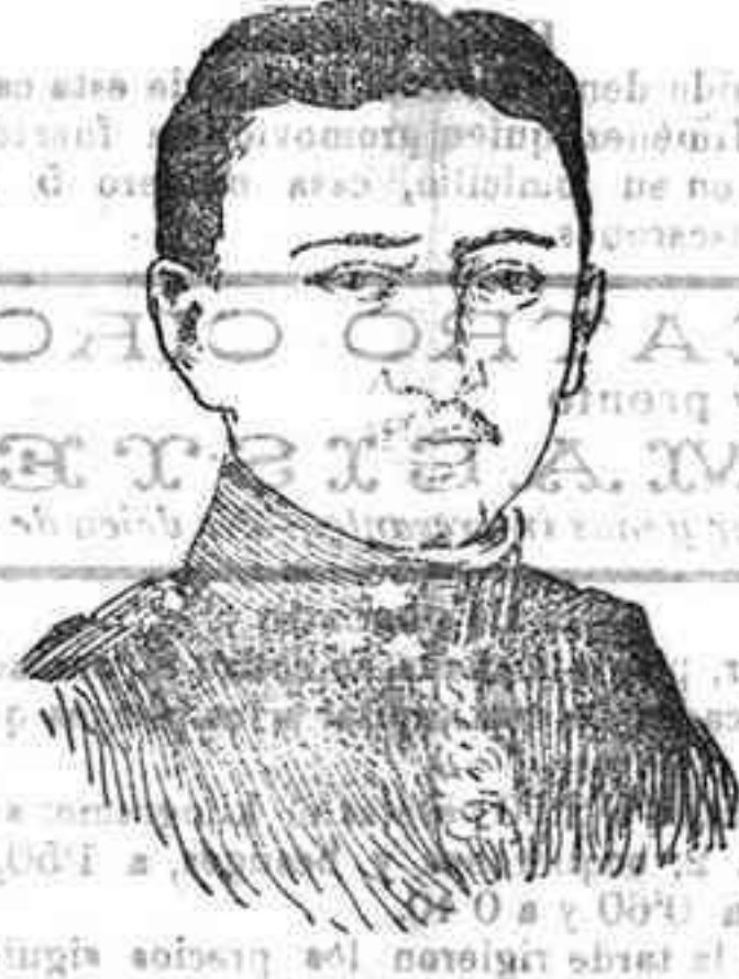
El archiduque Carlos Francisco José, nuevo emperador de Austria.

Emperador de Austria, Rey Apostólico de Hungria, Rey de Bohemia, Dalmacia, Croacia, Estarvonia, Galitzia, Lodomeria, Iliria; Rey de Jerusalén, Archiduque de Austria, Gran duque de Toscana y de Cracovia; duque de Lorena, Salzburgo, Stiria, Carintia, Carniola y de Bukovina; gran Príncipe de Transilvania, Margrave de Moravia; duque de la Alta y Baja Silesia, Módena, Parma, Plaisancia, Guastalla, D'Auschwitz y Zator, Teschen, Friul, Ragusa y Zara; conde principal de Hapsburgo y Tirol, Quiburgo, Gorizia