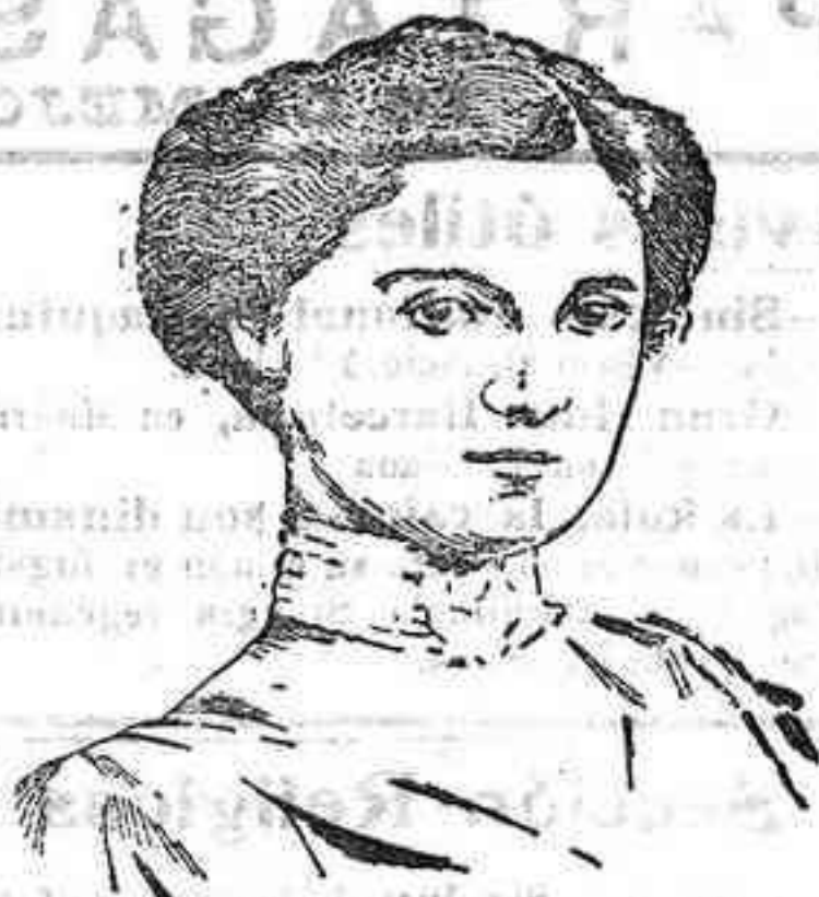
LA NUEVA EMPERATRIZ.—La princesa Zita de Borbón, esposa del archiduque Carlos Francisco José.

Levantábase al rayar el día e iba enseguida a tomar asiento al lado de su mesa de trabajo, sobre la cual se ofrecía aún a la vista una preciosa miniatura del duque de Reichstadt. Apenas descansaba el tiempo preciso para almorzar y para comer, porque todo su afán era adquirir elementos de juicio y formar opinión propia en el estudio de los asuntos de gobierno.