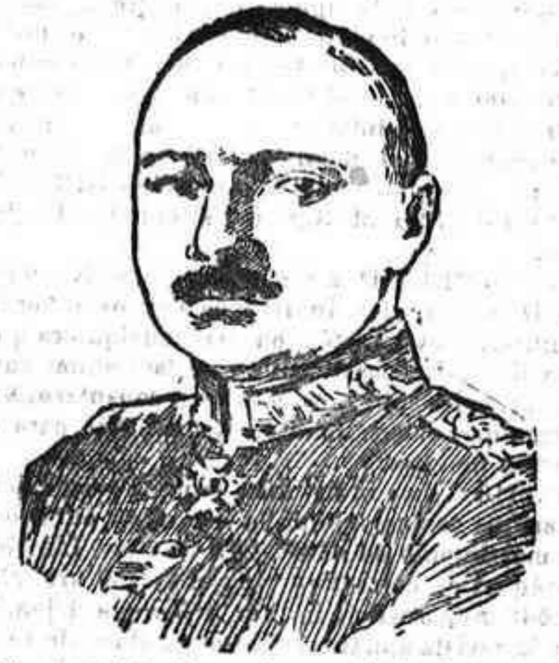
El general Dellmensinguer, jefe de las tropas bávaras que luchan contra Rumania en los Alpes de la Transilvania.