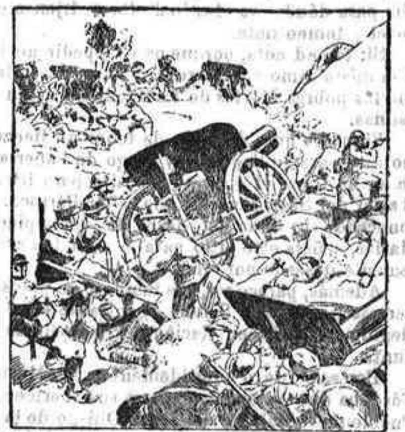
CUÁDROS DE LA GUERRA.—Infantes austro-alemanes e italianos disputándose con un contrabando la posesión de una batería.