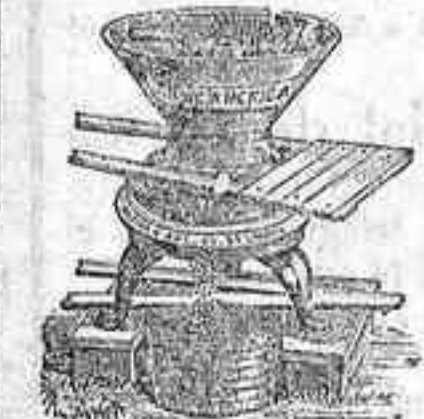
MOLINO AMERICANO PARA CABALLERIA ESPECIAL PARA TRITURAR GRANOS GORDOS

Tenemos también otros modelos diferentes, construcción inglesa para ser movidos a brazo y a motor