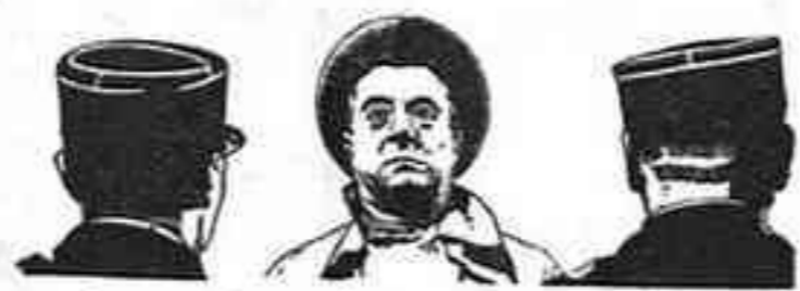
Raimu, Lucien Baroux, Edwige Feuillère