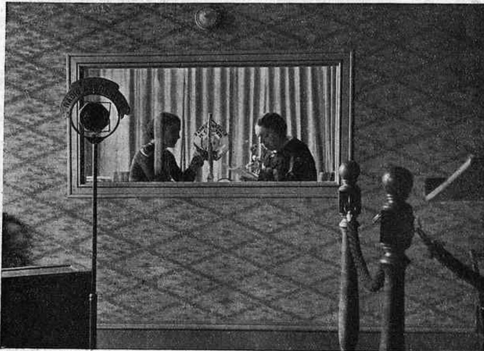
La cabina de Ràdio Associació

El cercle de les seves funcions és ben vast. Li cal encarregar-se al mateix temps de la posició dels músics davant del micròfon; de les condicions de la construcció de la sala (sobretot de la qüestió de l'apagament); de regular l'energia elèctrica de l'emissió; de vetllar per la millor manera de tocar els instruments i de cantar davant el micròfon; de calcular les proporcions acústiques de tota l'emissió. Finalment, és indispensable per a triar els artistes i per a preparar els programes, ja que coneix les mi-