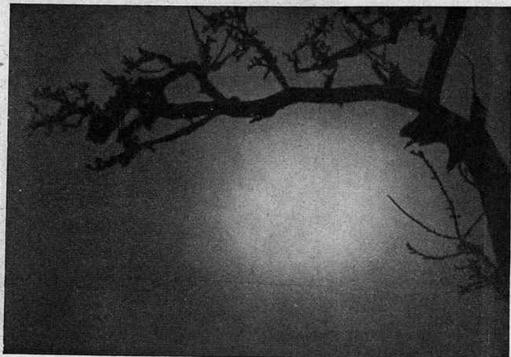
«Romança sentimental», d'Eisenstein

El primer és un film que té el mèrit de mantenir viu sense interrupció l'interès de l'espectador. Un bon film comercial, amb Brigitte Helm. Aquesta dona, que, com tan-