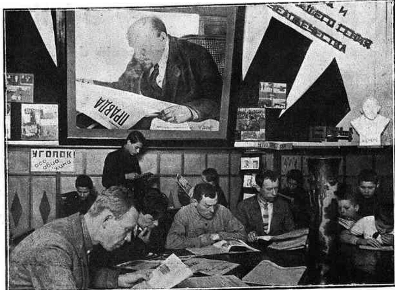
Sala de lectura d'un club de Moscou

creat un curs especial en llur llengua. El