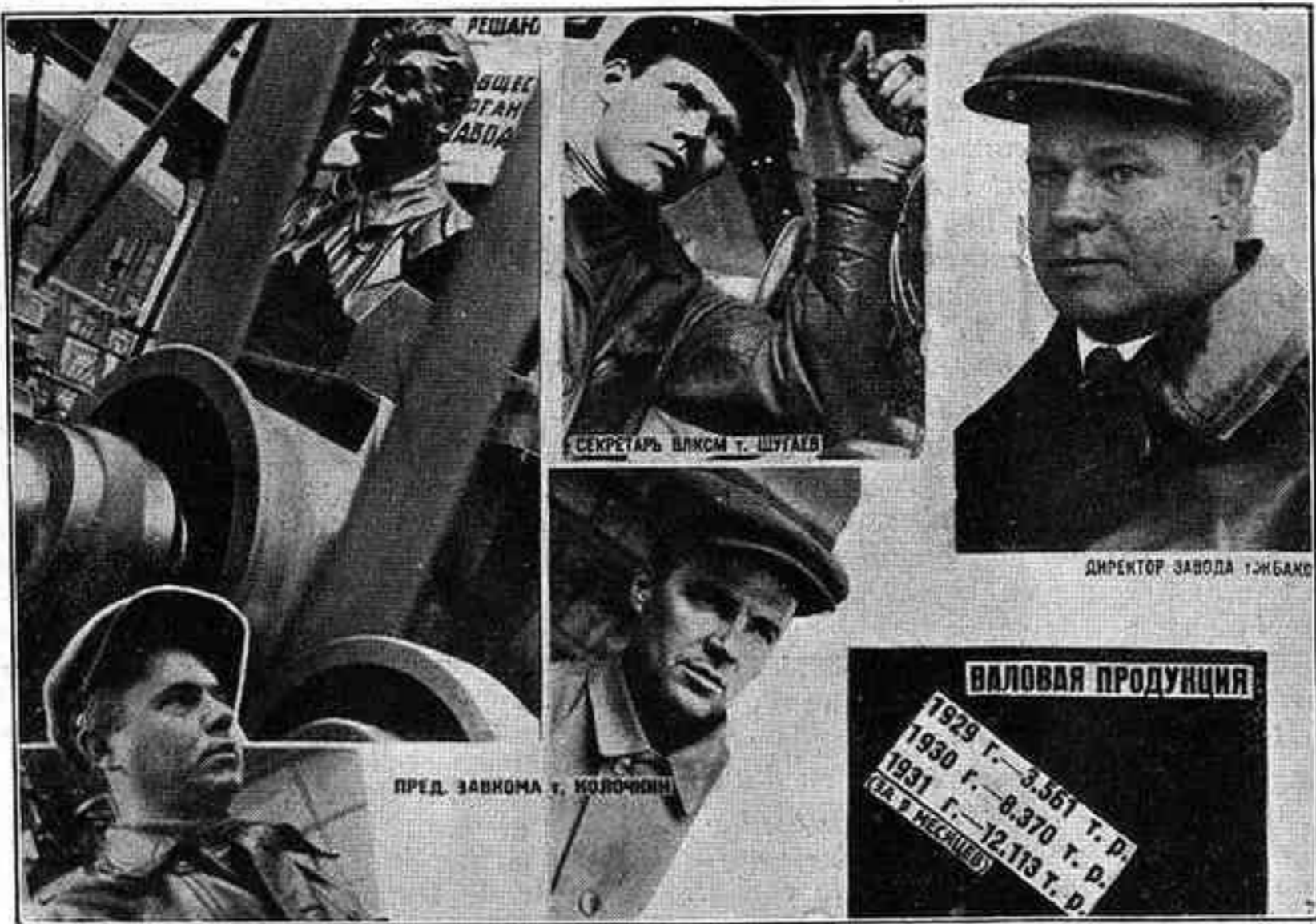
Propaganda de la fàbrica del Proletari Roig, de Moscou