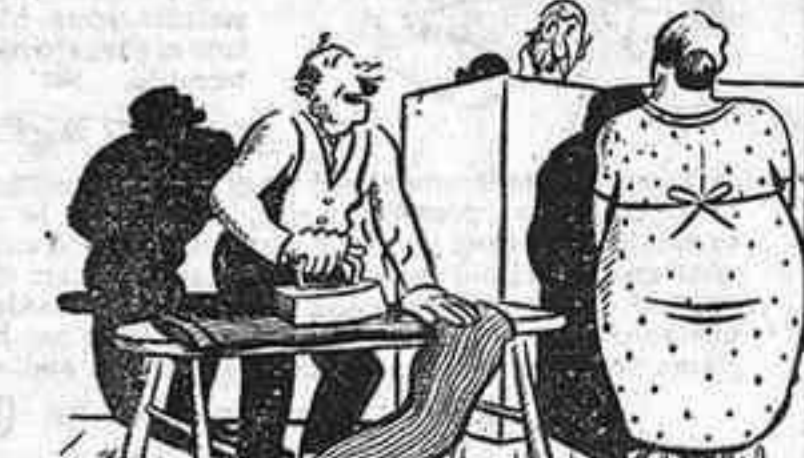
—Ja pot sortir; és la meua dona. (Judge, Nova York)