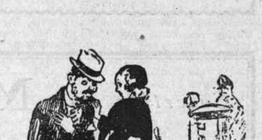
—No sé si haviem quedat pel dilluns o pel dimarts, però estava segura que m'esperaries. (The Passing Show, Londres)