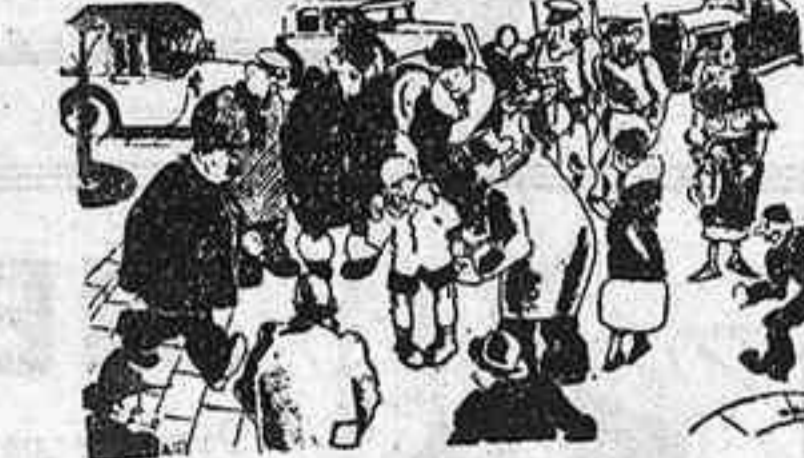
—Per què plores encara, si ja t'he donat el ral que has perdut? —Es que si no l'hagués perdut, ara en tindria dos... (Ric et Rac, París)