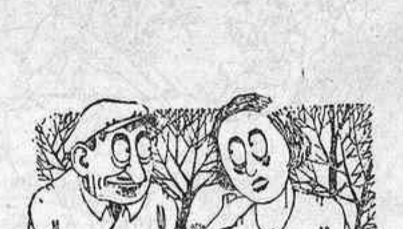
—Demà fa anys que ens vam casar. Què et sembla si matéssim el pollastre negre? —Quina culpa hi té, pobre bestia? (Le Matin, París)