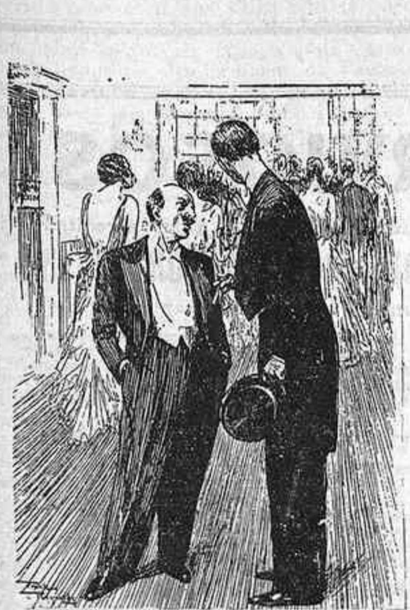
—Ja em comencen a agradar les faldilles llargues. Em torno a acostumar a mirar la cara de les dones. (Punch, Londres)