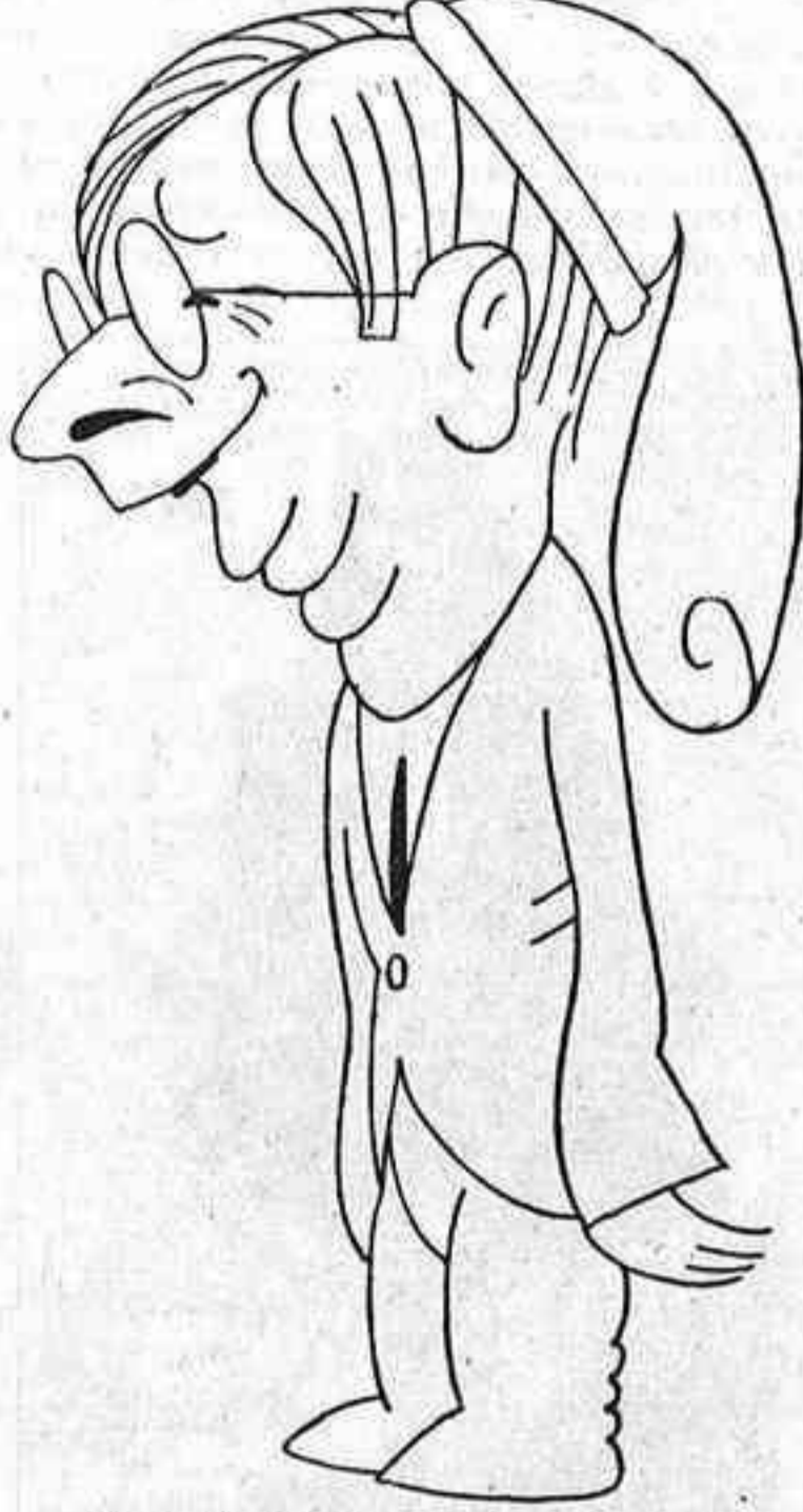
Marcellí Domingo, per Bagaria

donat resultats lamentables: un tant per cent esquifidíssim de comerços catalans anuncien a l'exterior de llurs establiments llurs productes en la llengua del país; un tant per cent, també reduït, llegeix la premsa catalana.