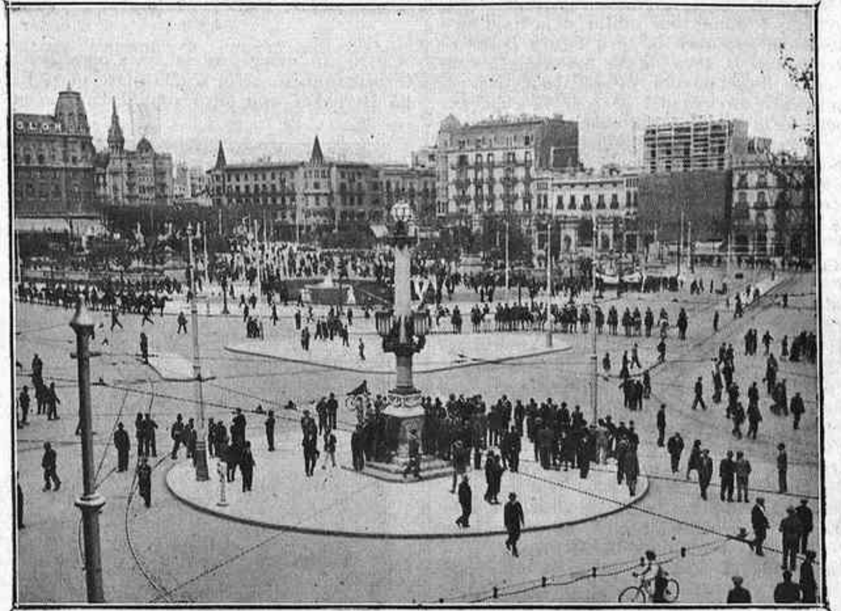
Aspecte de la Plaça de Catalunya en la diada del Primer de Maig

Un visca l'anarquia! ara sona com visca Alfons XIII! I, en efecte, aquests dos visques, a hores d'ara, van contra la llibertat que es diu República.