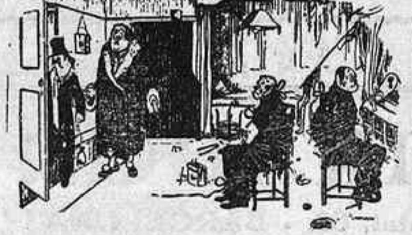
—Ara són hores d'arribar? I mentrestant, la teva dona indefensa a mercè dels lladres!