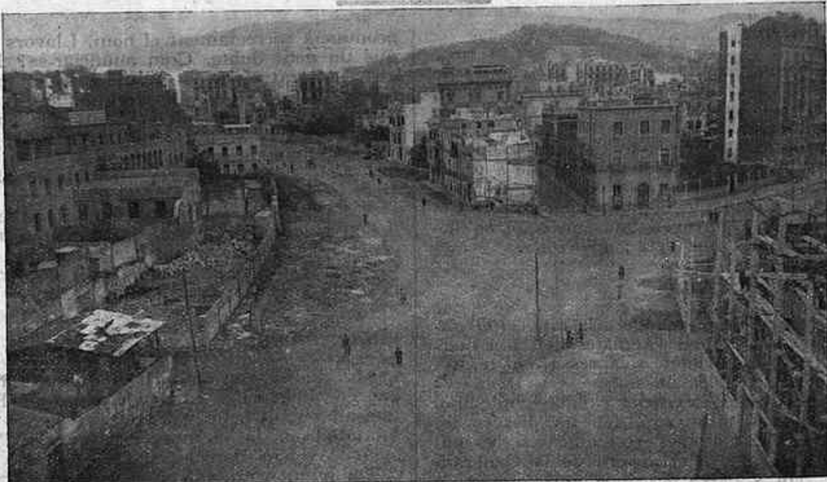
L'estat actual de la Plaça de Gala Placídia

La Via Augusta, amb les seves places de Gala Placídia i de Molina, podria dir-se