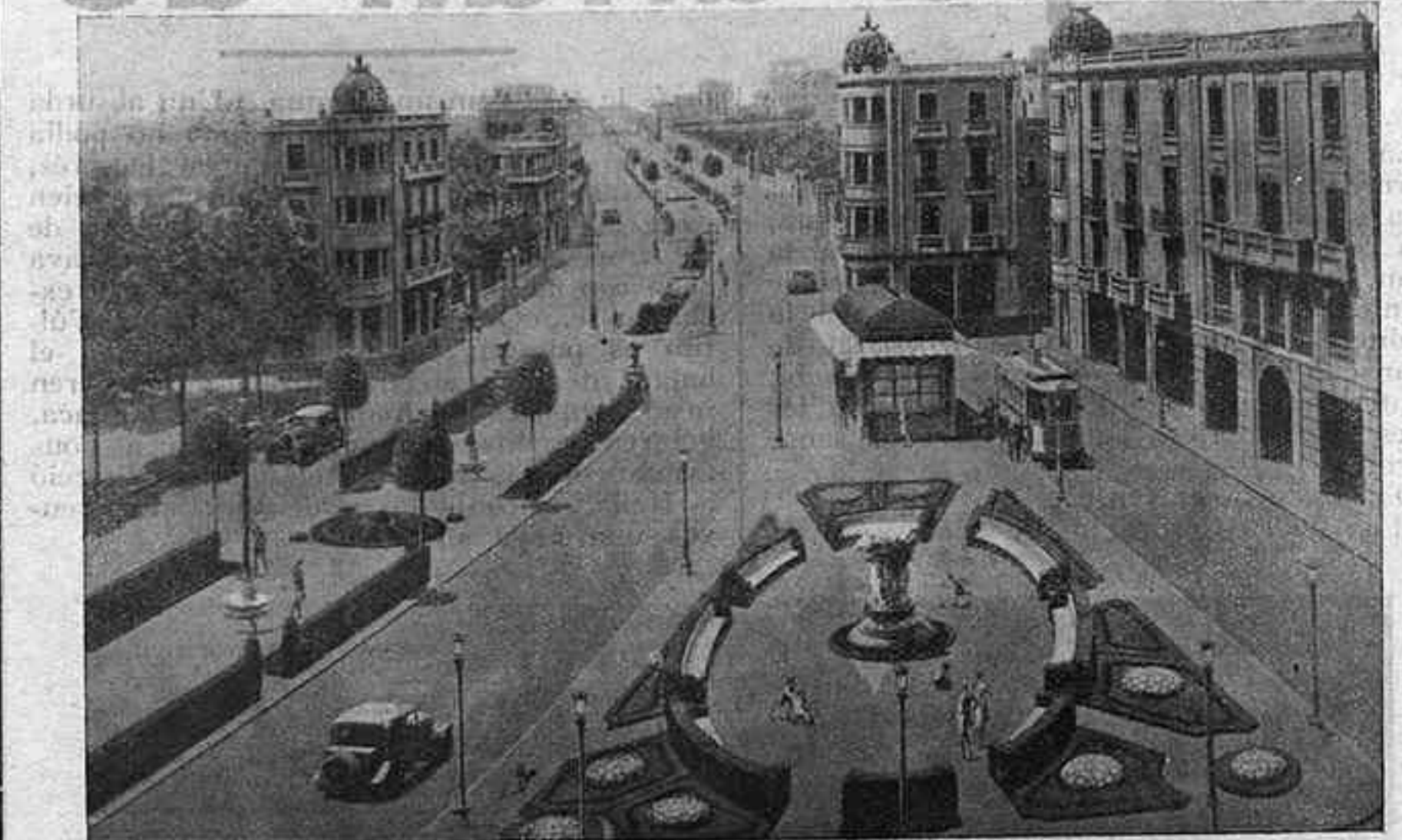
Projecte d'urbanització de la Plaça Molina

Sobre haver-se'ns donat jardins i parcs,