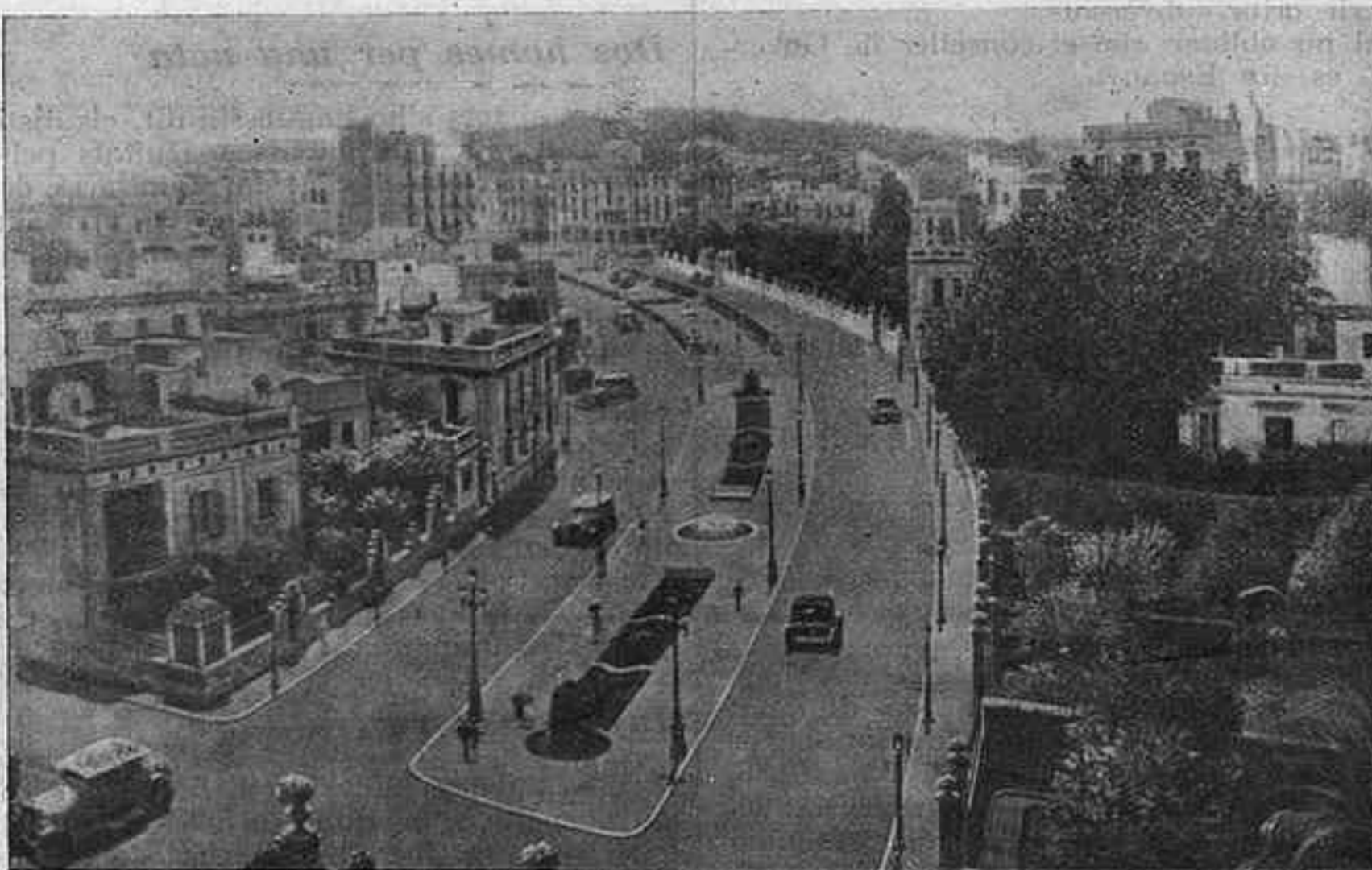
Projecte d'arranjament de la Via Augusta des de la Plaça Molina a Muntaner

Pràcticament, la urbanització de la Via Augusta suposa comptar amb una nova via