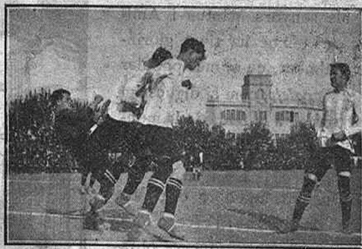
L'Homs salvant un «corner» contra el Barcelona

Com que'ls dos equips eren de fora de casa, el públic hi va assistir amb aquella tranquil·litat i «tant-se-m'en-dona», és a dir: guanyi qui pugui. Els «civils» ens mostraren ésser més bons que els de Crook i guanyaren els primers. Aquests porten un porter