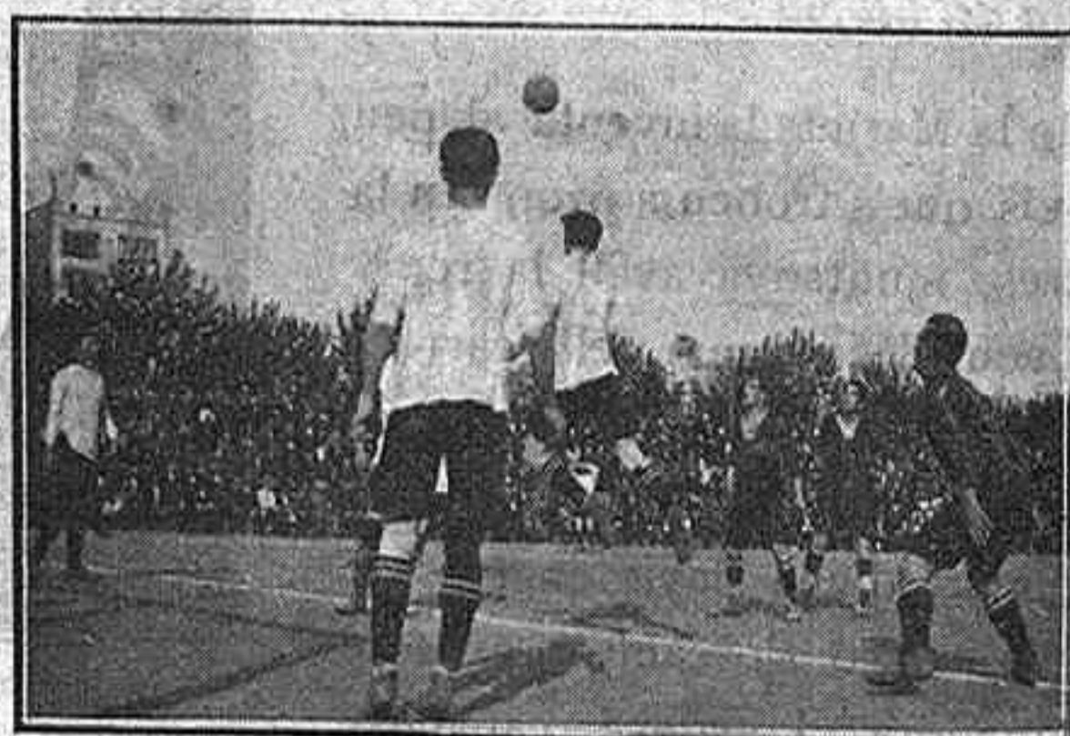
Un salt del defensa anglès

Es veu que als jugadors «europeos» no'ls hi agrada la Marina , puig la majoria de jugadors del primer equip no's varen presentar per a lluitar amb els badalonins, i aquests aprofitant-se de l'ab-