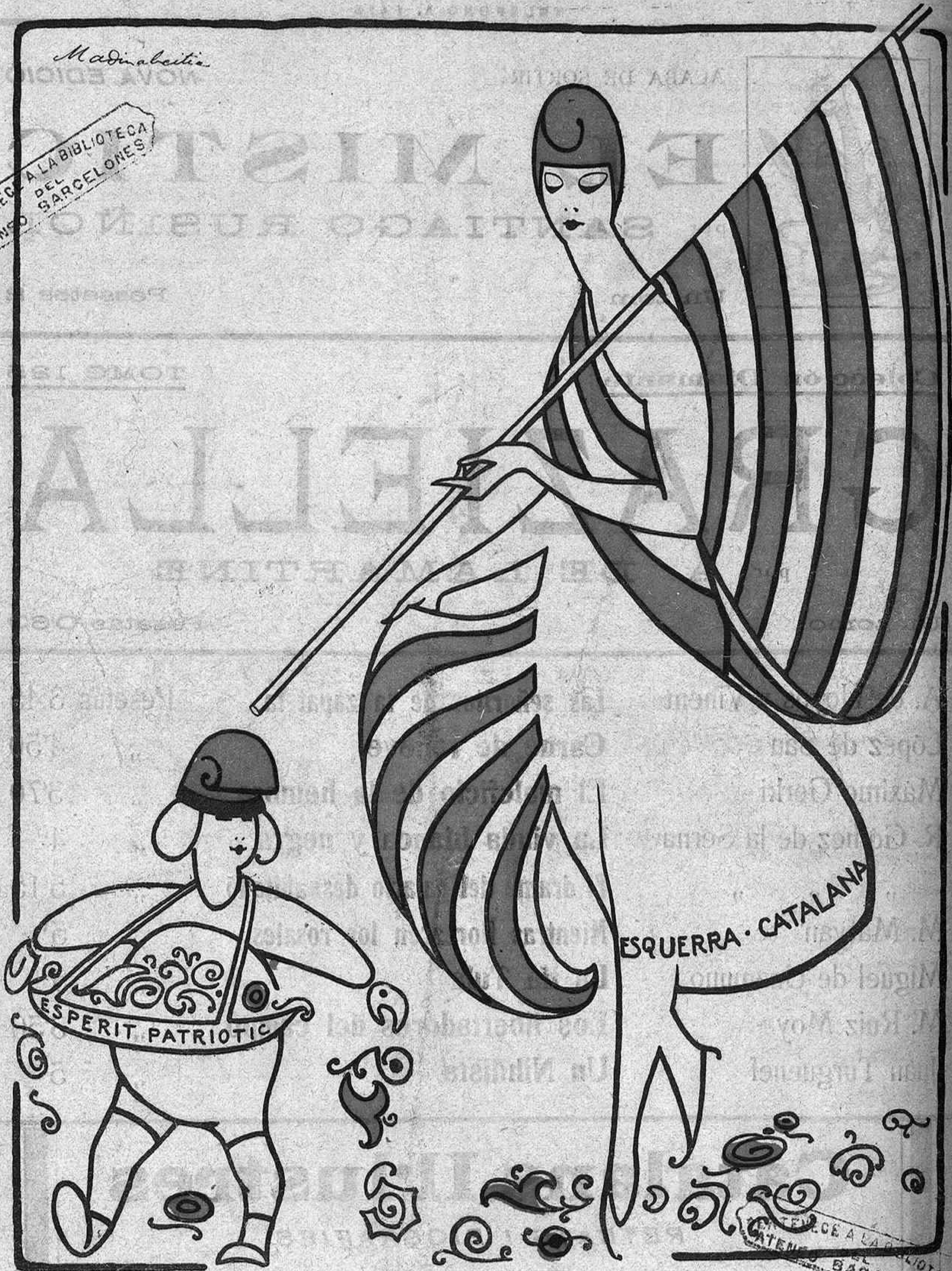
DESPRES DE LA FESTA

PERTENEC A LA BIBLIOTECA ATENEU DEL BARCELONES