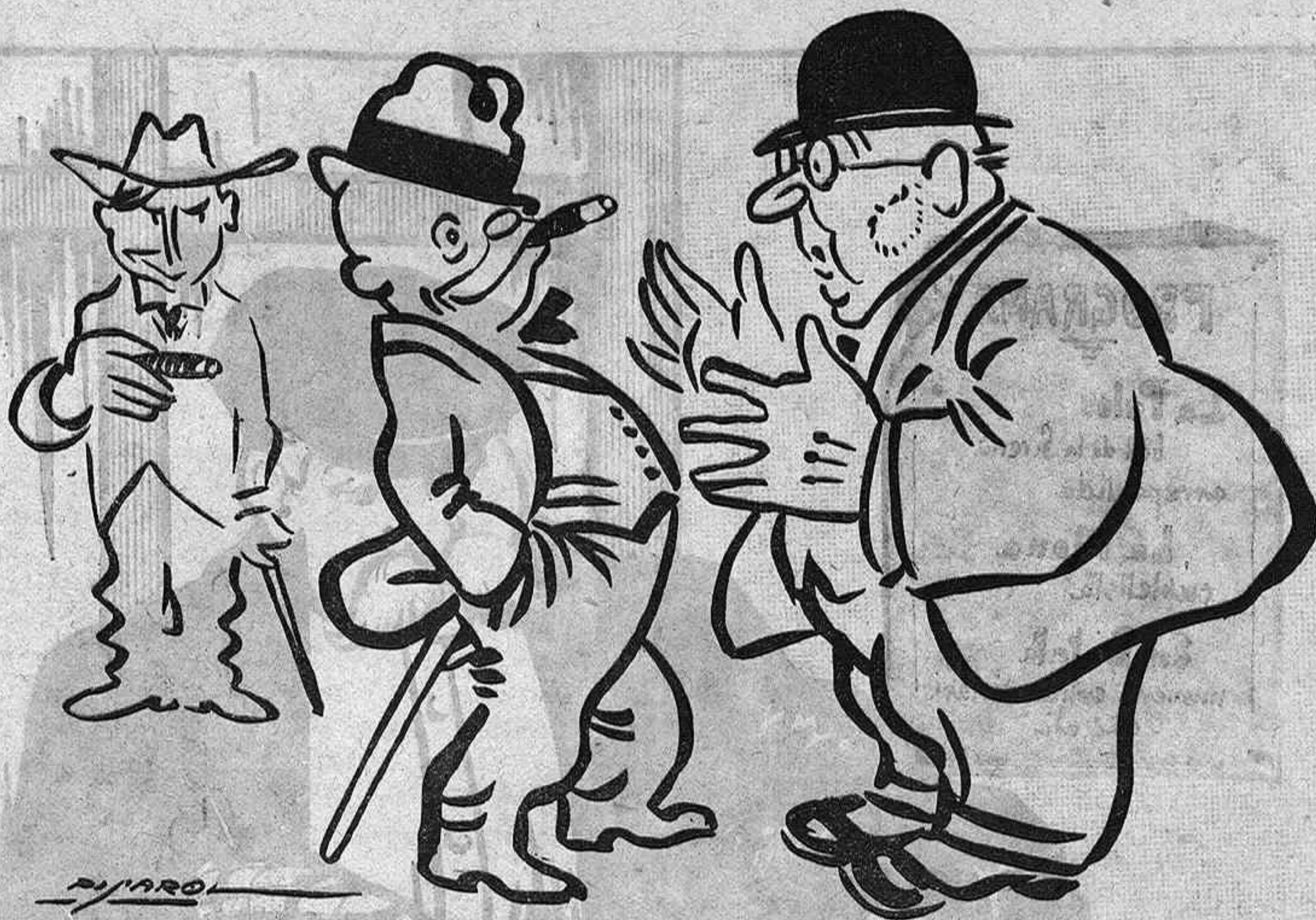
ELS PUROS ALEMANYS