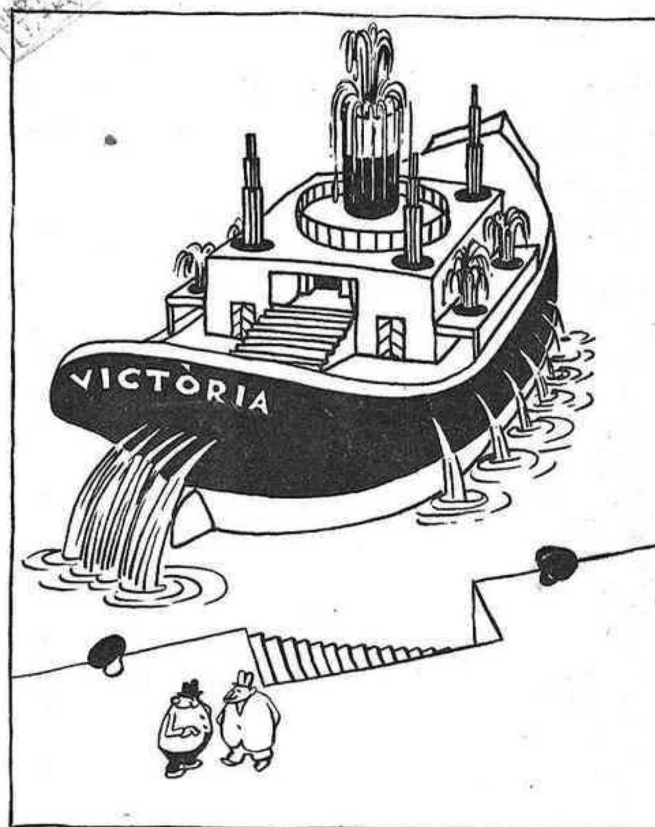
LES IDEES LLUMINOSES DEL SENYOR BOHIGUES —Veus?, amb aquest vaixell no m'hi embarcaria mai... Ha d'ésser una exposició constant!