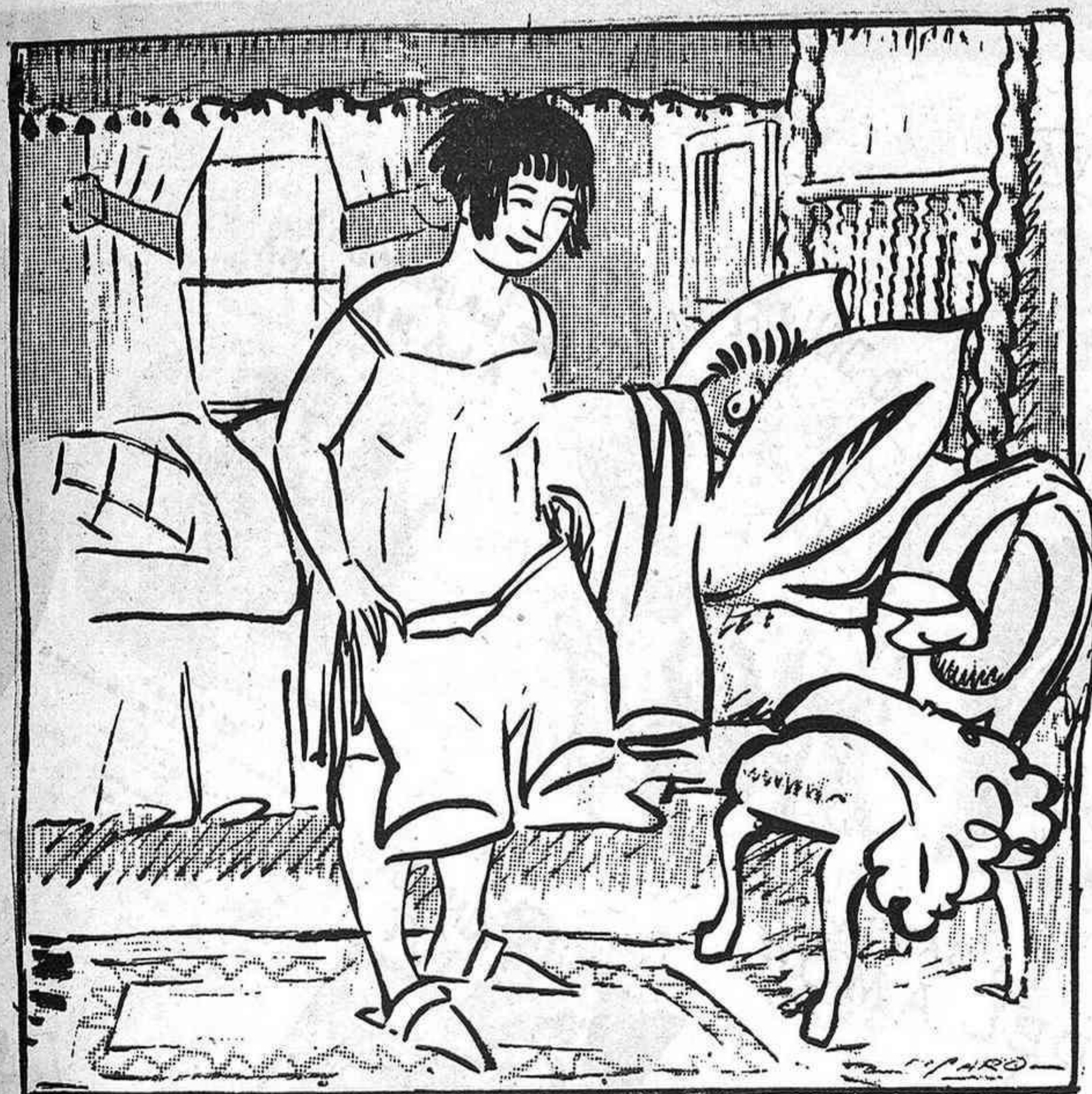
LES MODES D'ARA

—Ara no sé si són els meus o els del meu marit.