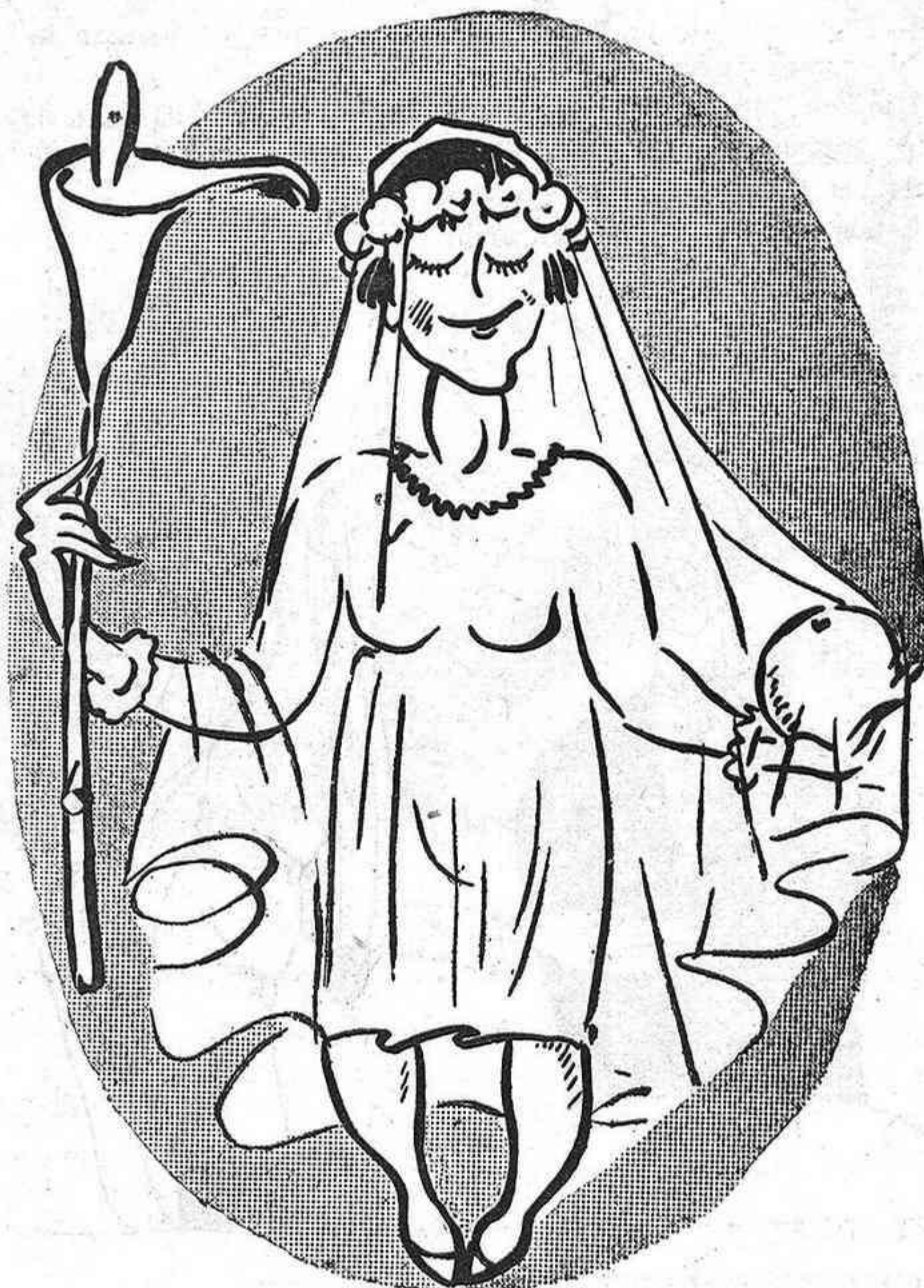
MES DE MAIG

Això està molt bé; divinement bé, però ara el que falta és que en el partit de diumenge, tornin a fer la mateixa.