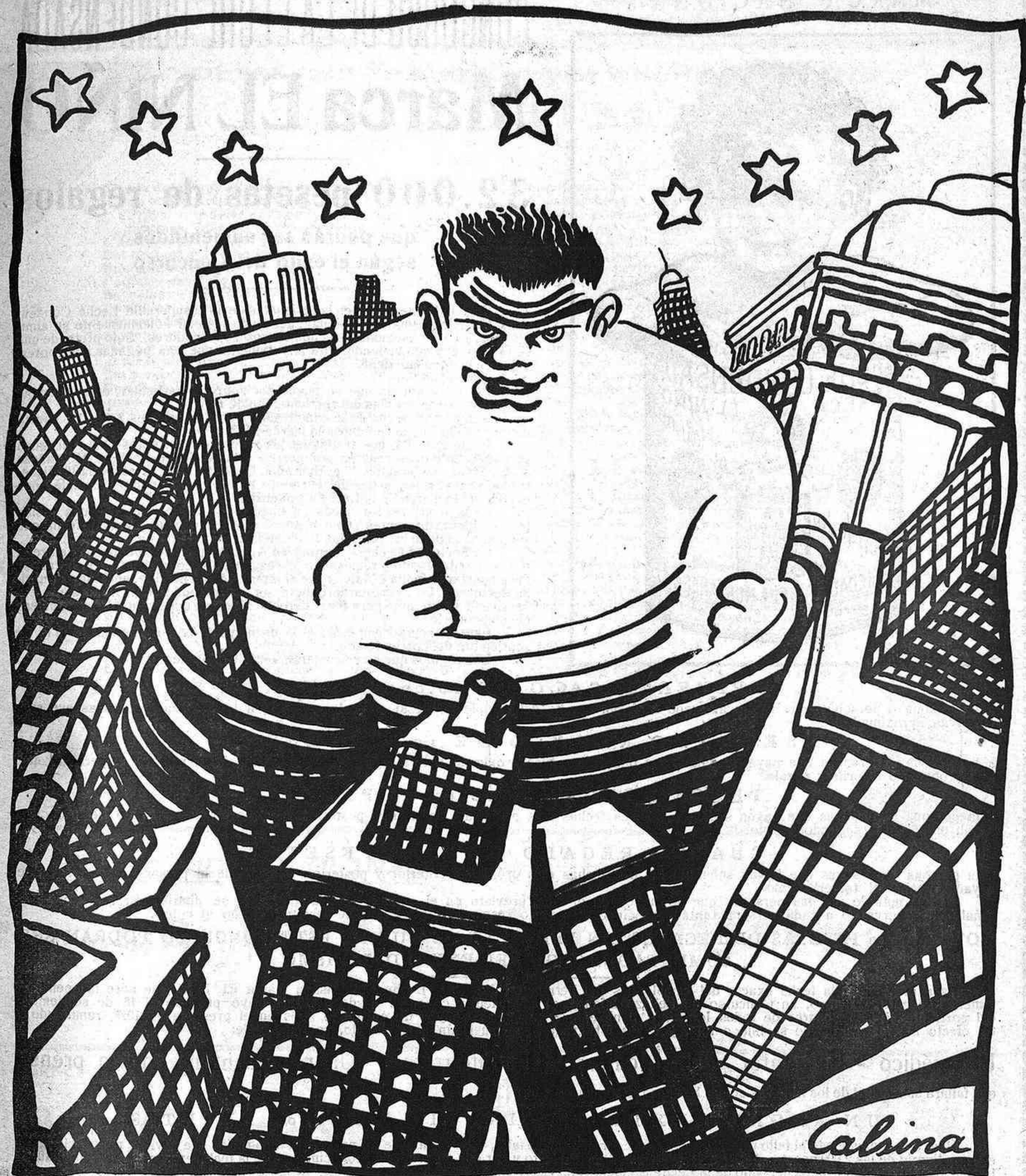
SANT COP DE PUNY

L'Uzcudun fent trontollar els rascacels de Nova York.