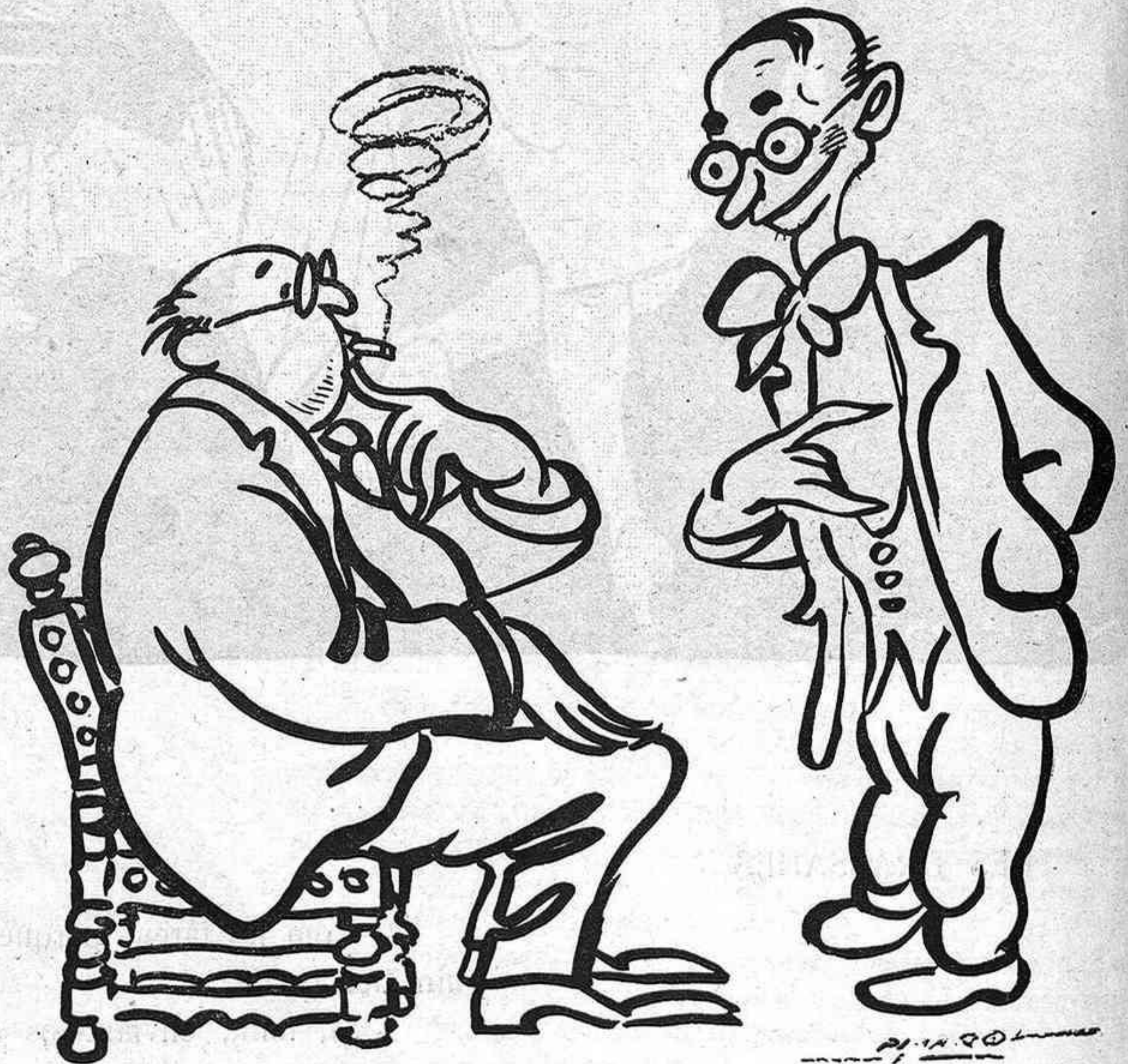
UN QUE HI ENTEN

—No siguis banau, home! Per al pare o per al fill?