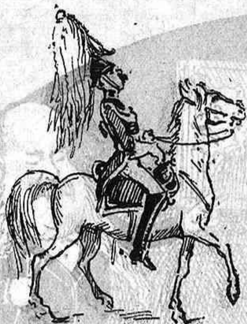
Se tindrà dret.