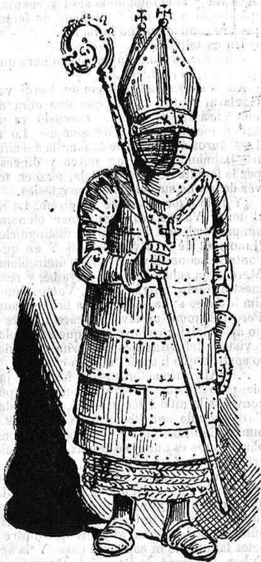
Traje episcopal: últim modelo.

ni te 'ls allisis ni treguis com los de la fusta ab mástich, tú ab unturas y cosmétichs.