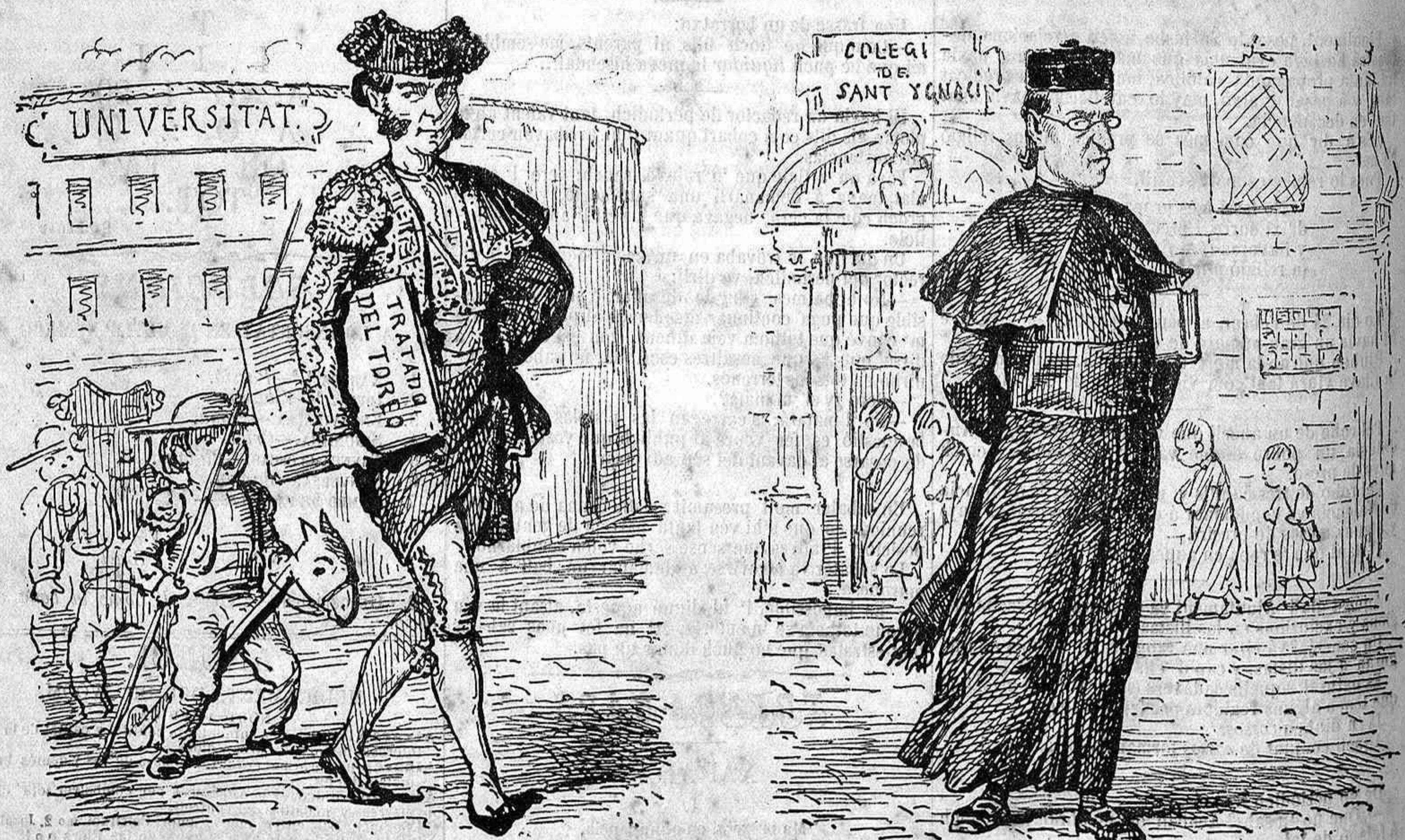
Unichs profesors d' ensenyansa á Espanya que tindrem are.