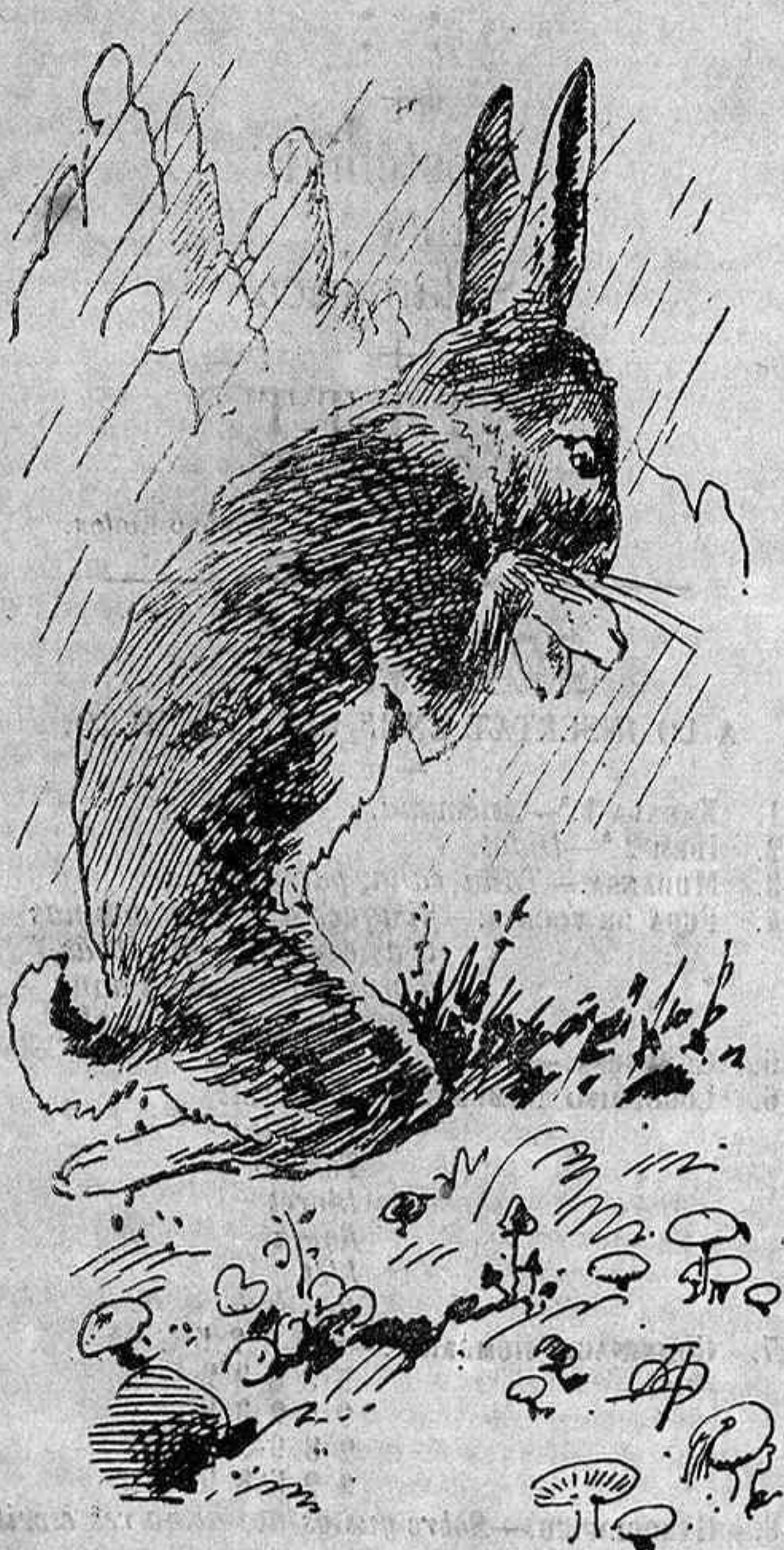
La llebra que fá bondat per fer ploure á Monserrat.