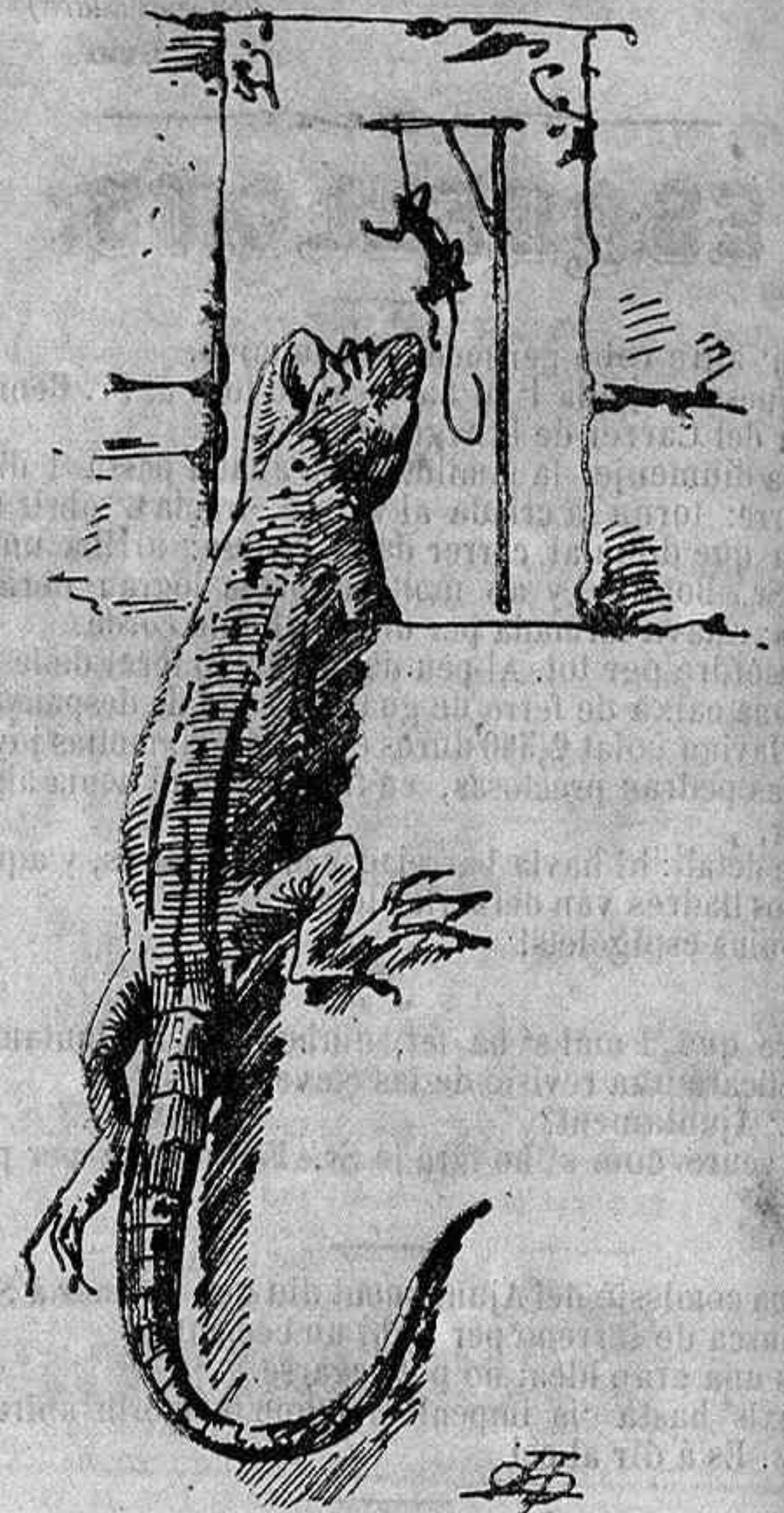
La Sargantana que treu lo cap y son pare véu penjat, á las forcas de Mallorca.