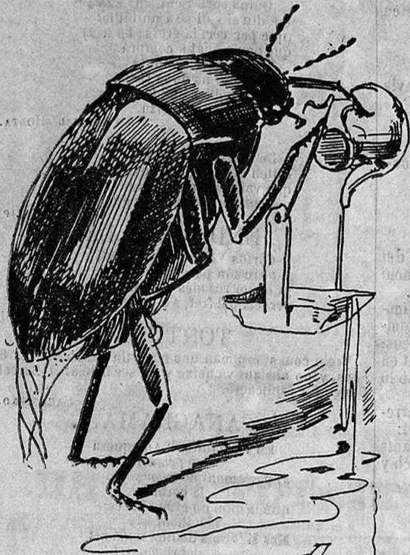
L' escarbat Bumbum que posa oli en lo llum.