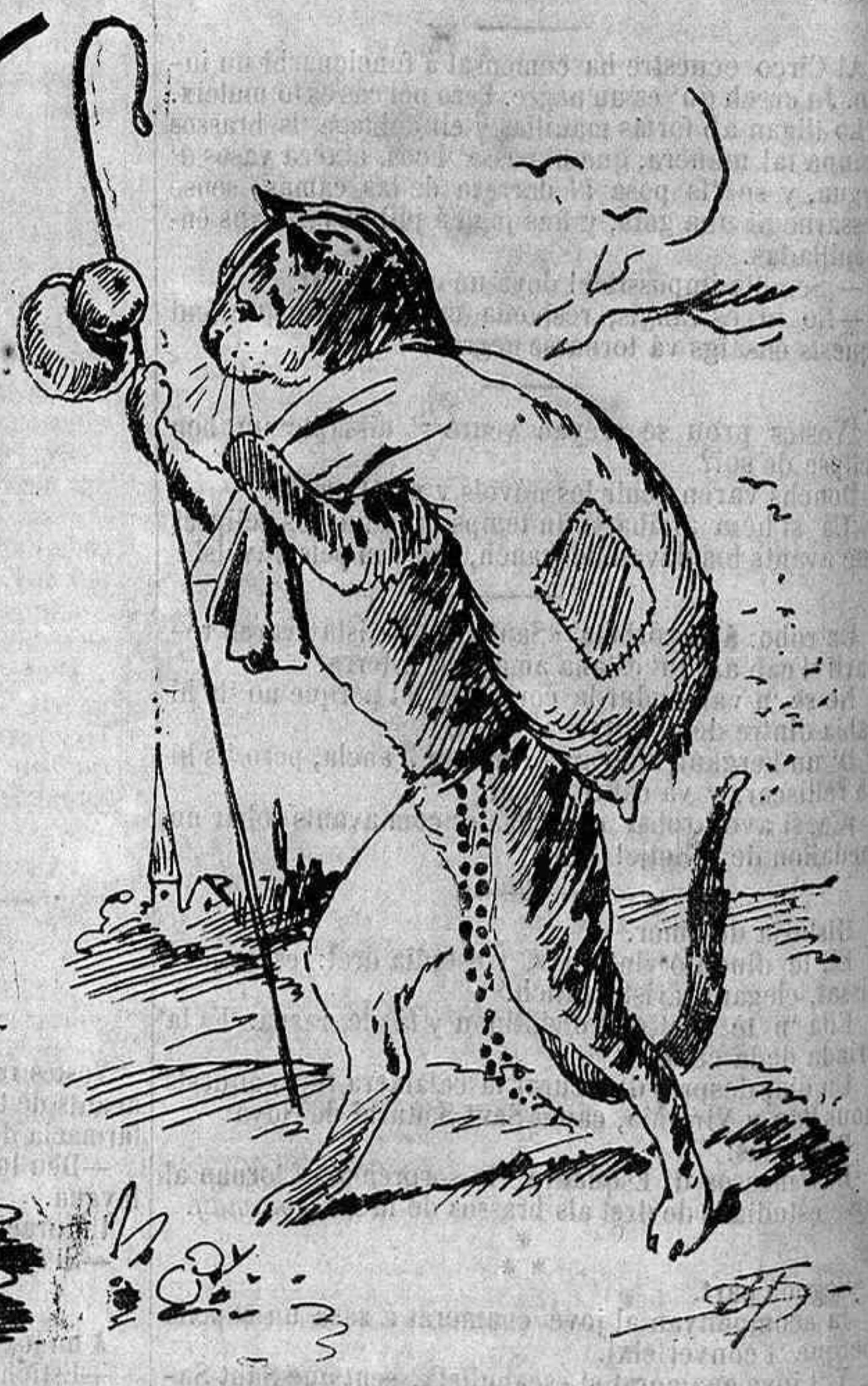
Lo gat dels frares.