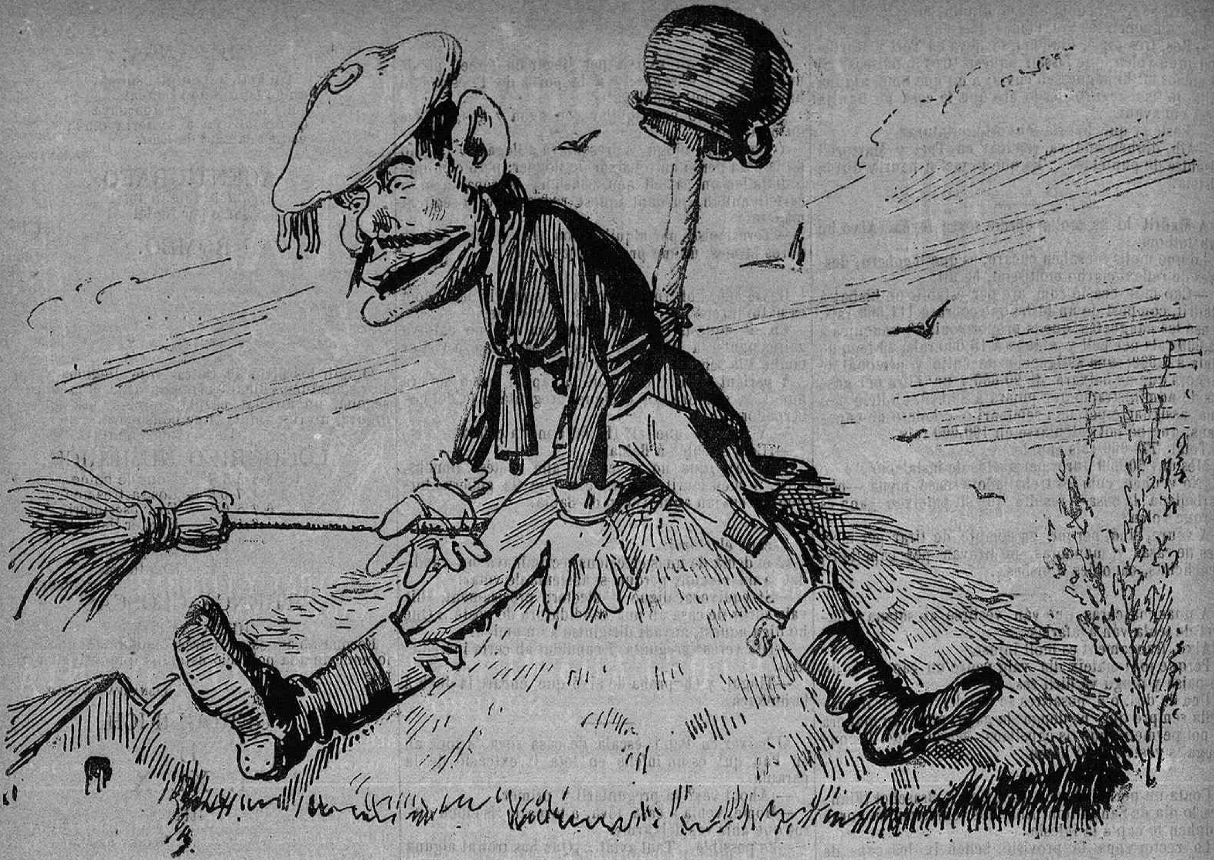
Lo verdader carnestoltas.