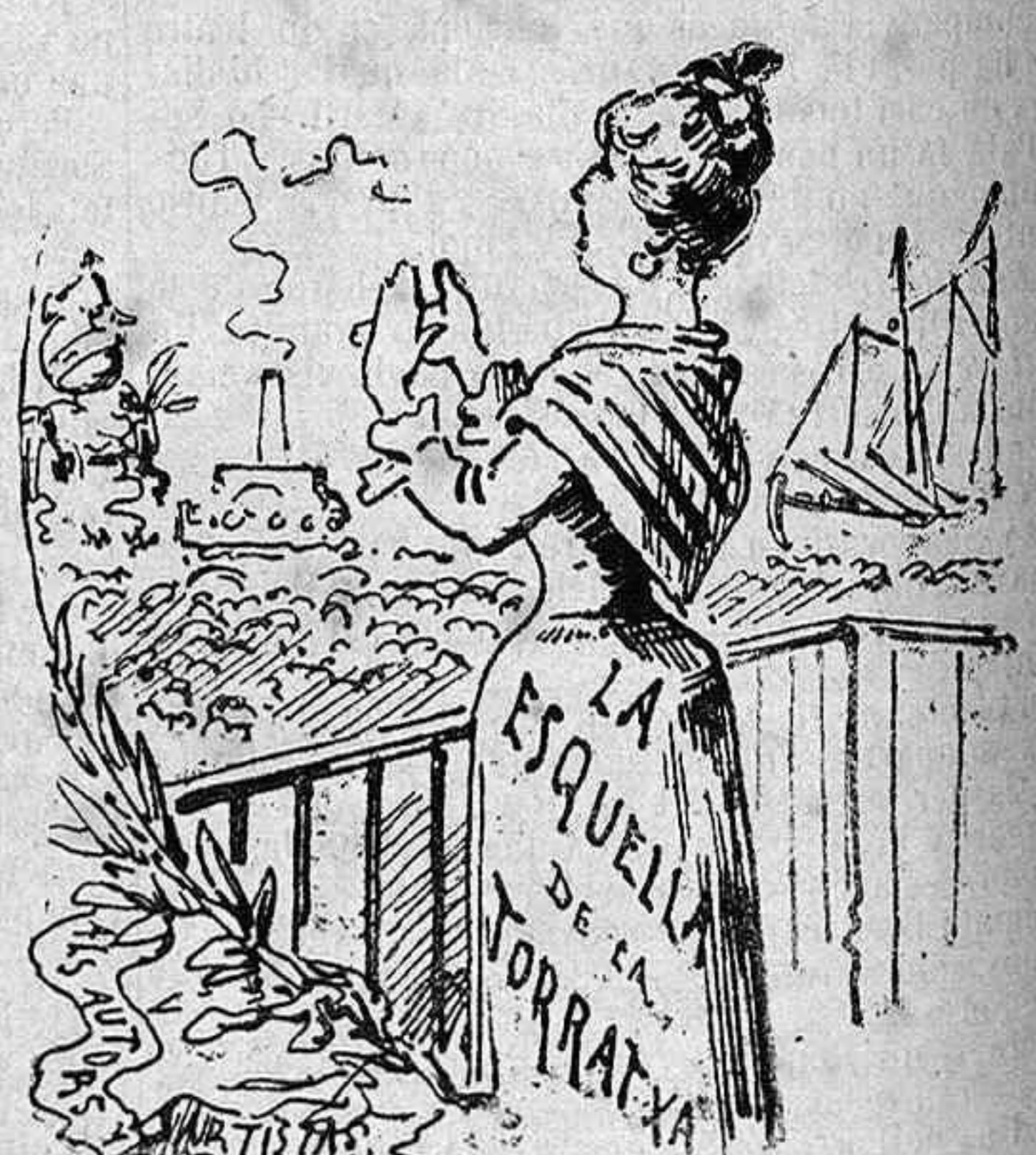
L' ESQUELLA envia un aplauso als autors y artistas de la cabalgata.