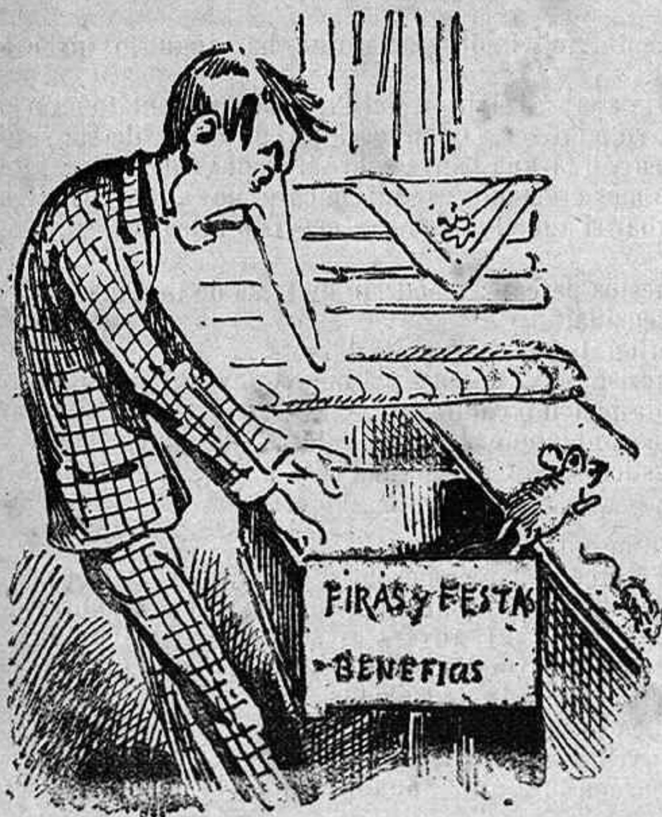
Desengany dels botiguers.