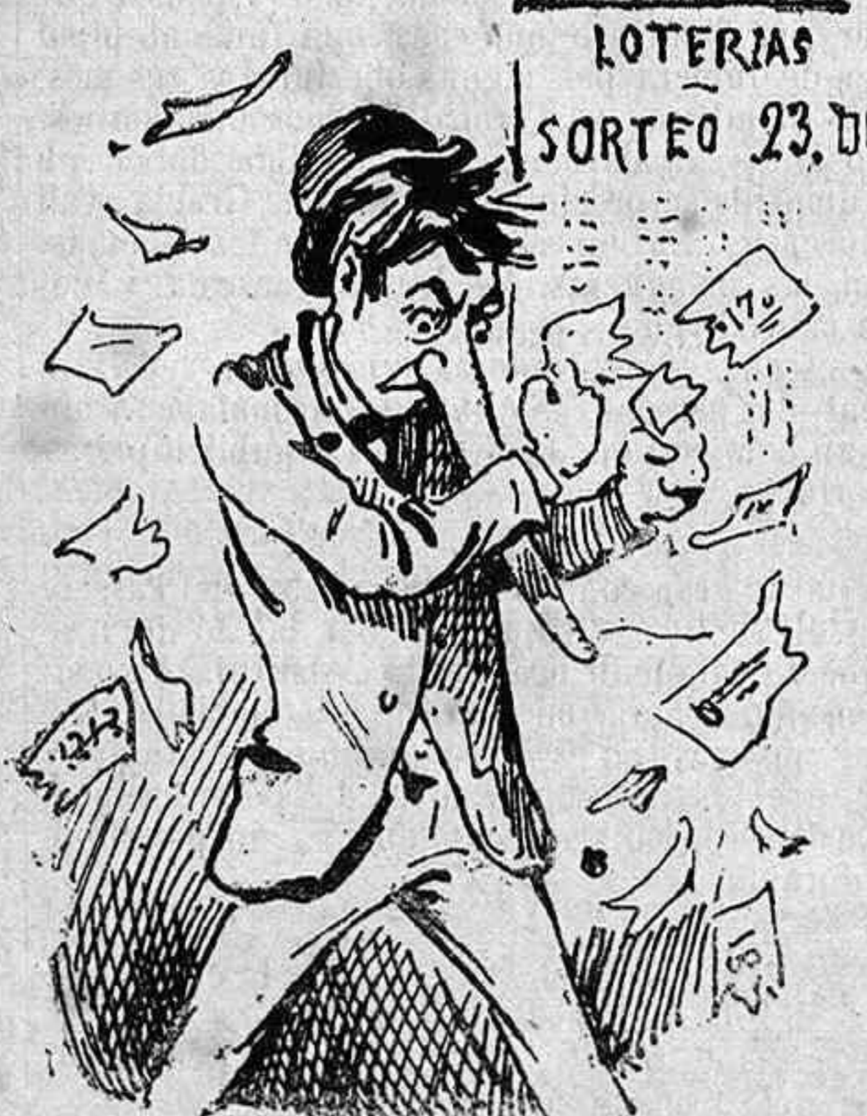
Desengany de la rifa.