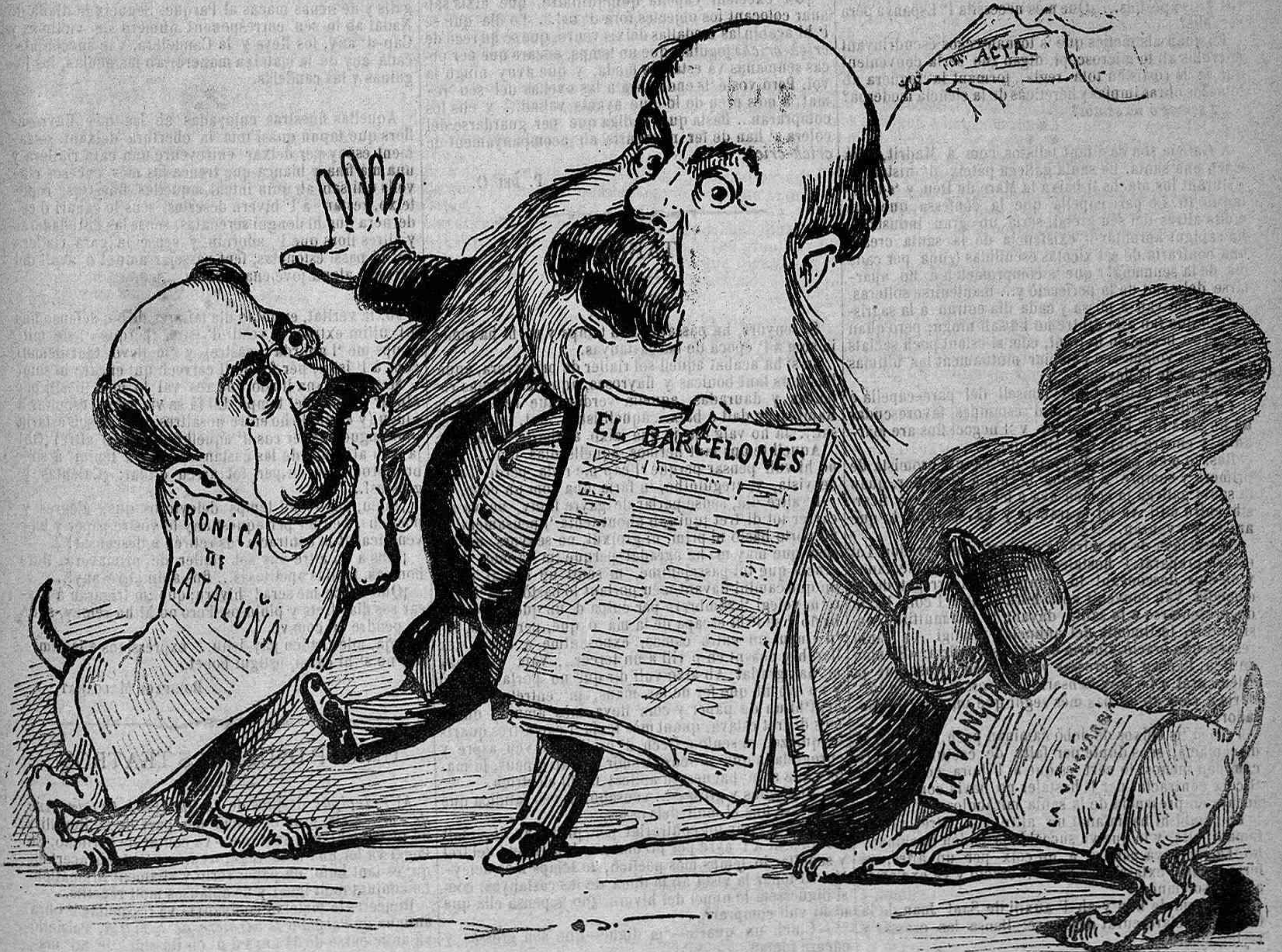
¡Pobre D. Francisco! Ni patillas li deixarán!