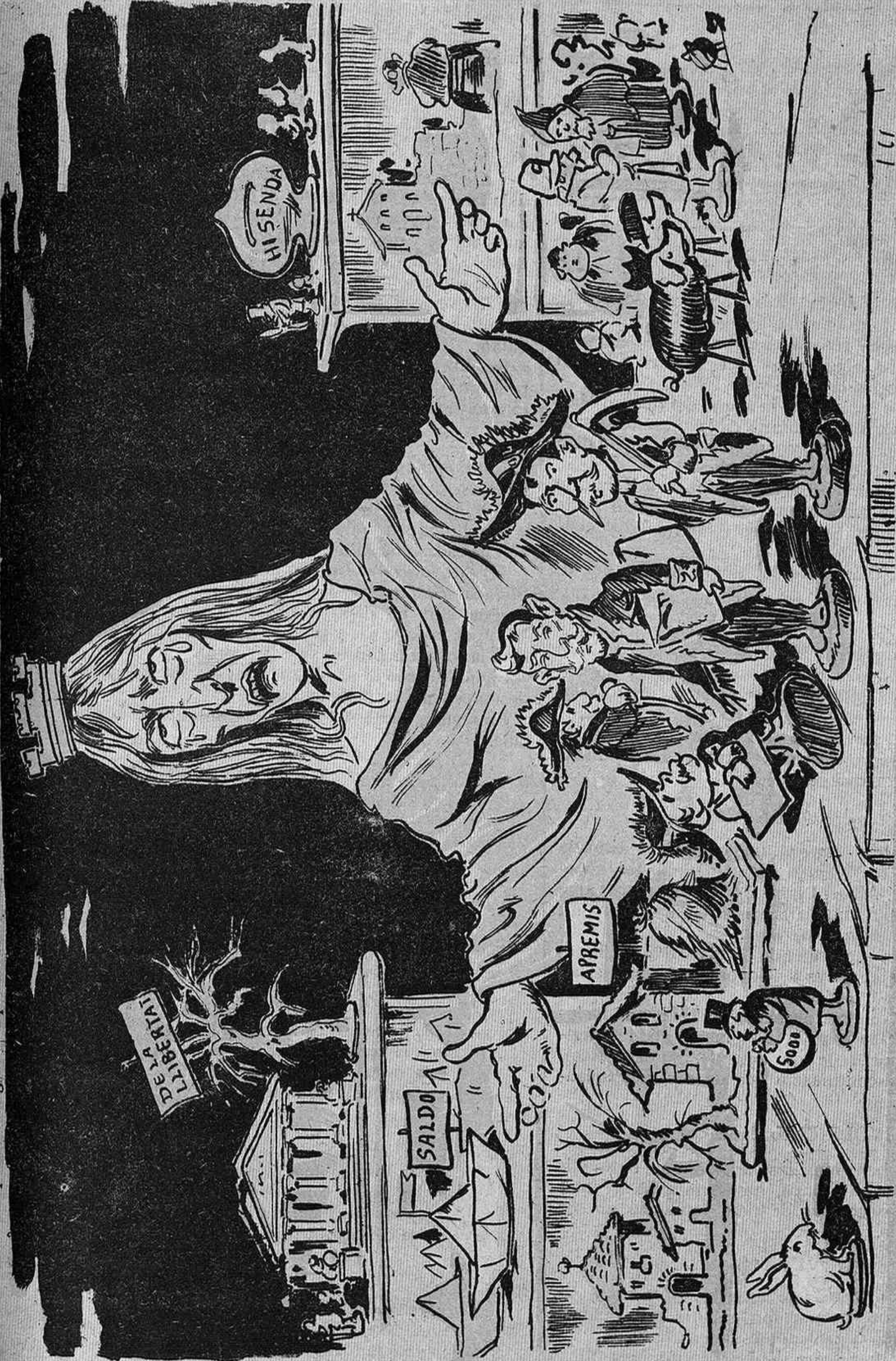
¡Suros y casas, bestias y figuretas! Tot ho dona la pobre Espanya per gualsevol diner! ¡¡Apa trihéu y remenéu, que la fam la mata!