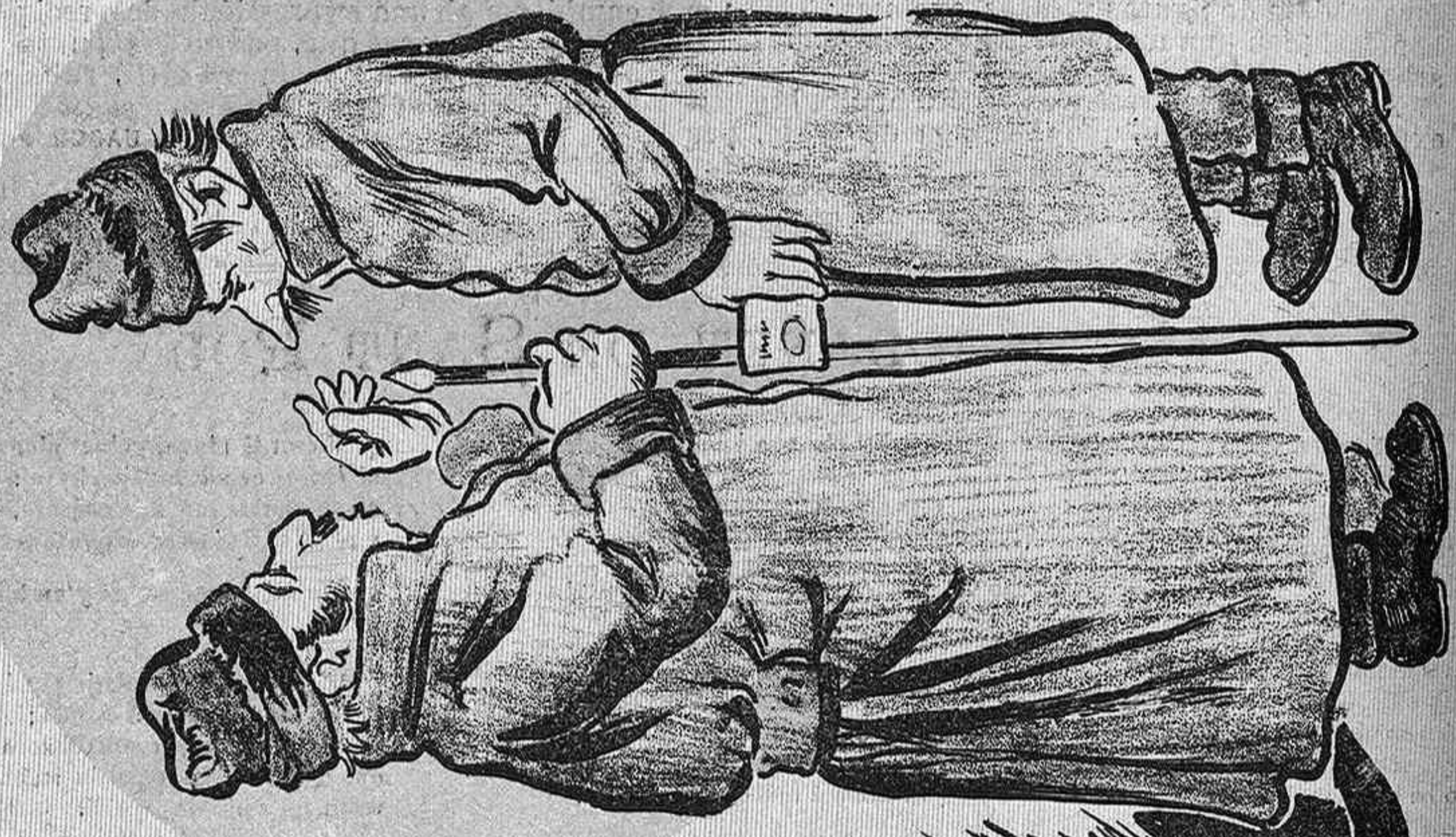
—Créme, Biel, si vols pescar bonas anguilas , ves a cal Estany, carrer de Sant Ramón, n.º 6, que las sevas décimas tenen alló que s' en diuen... se-