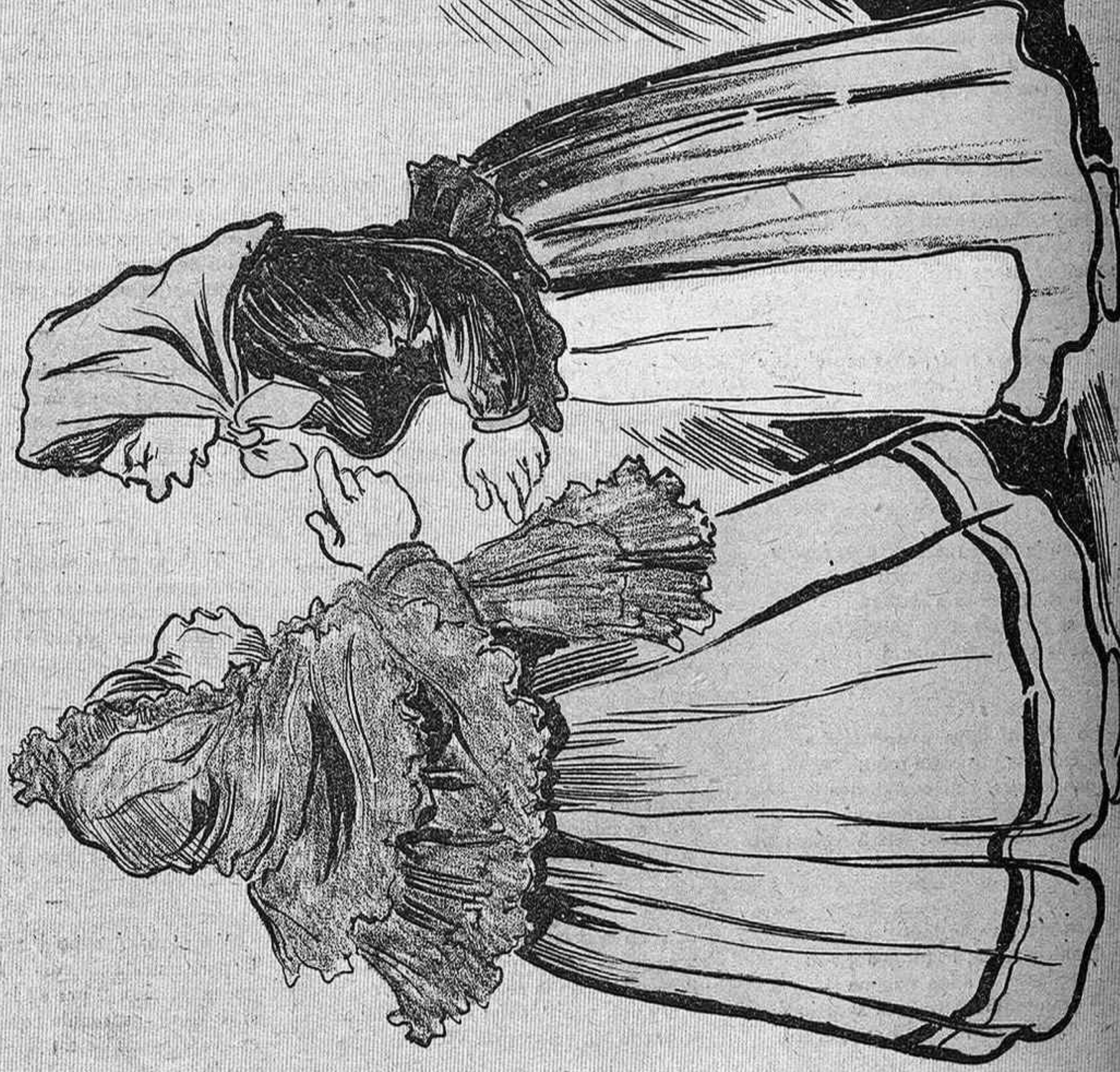
—Ja ho ha vist, senyora Tuyas, aquet condemnat regidor que li hi diuen Don Buen vol matar de fam a n' els pobrets hermanos que tenen col·