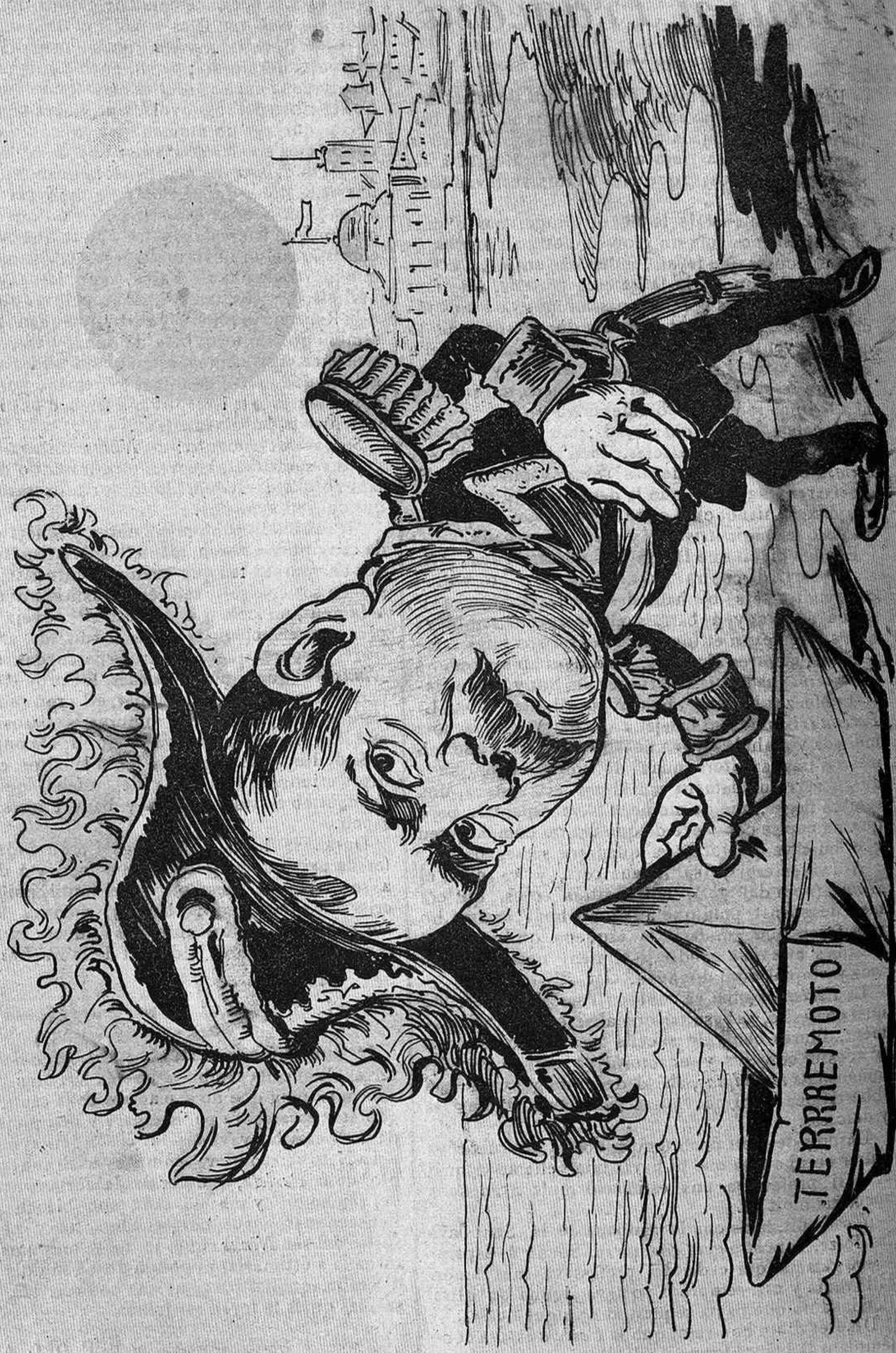
El ministre Cobian ja te a punt la gran esquadra pels de Sant Sebastián.

HISENDA PROJECTES D'IMPOSTOS NOVAS CONTRIBUCIONS