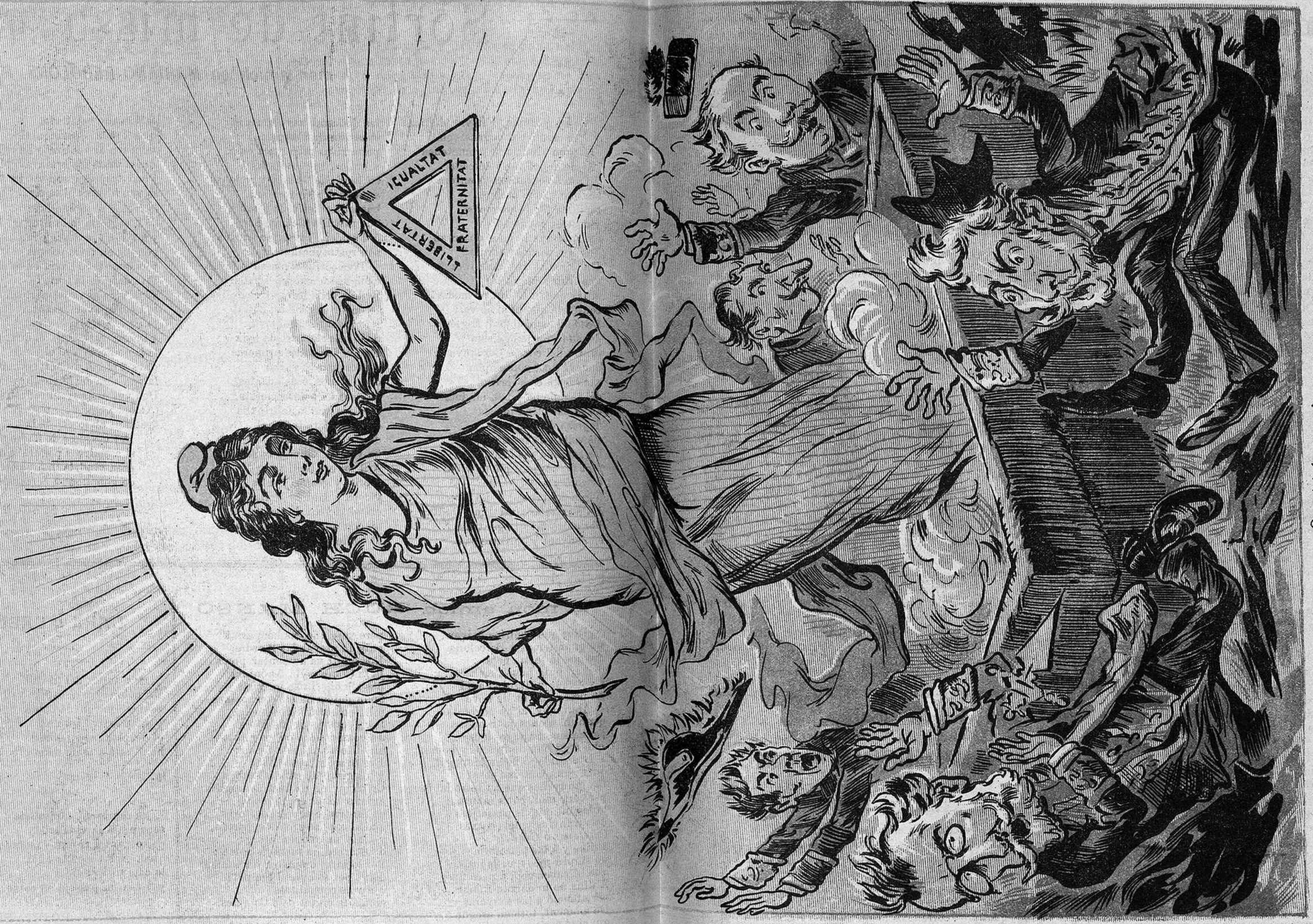
Quan tots la creyan ben morta ressuscita d'improvís, per demostrarnos qu'encare pot salvarse aquet país.