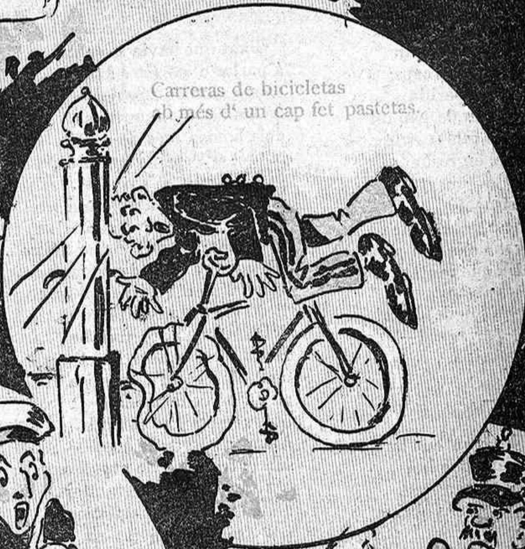
Carreras de bicicletes b més d' un cap fet pastetas.

En lo dilluns qu' hem passat y ab un programa variat, que la fama encara pregonava, la infanteria ha obsequiat a sa celestial Patrona.