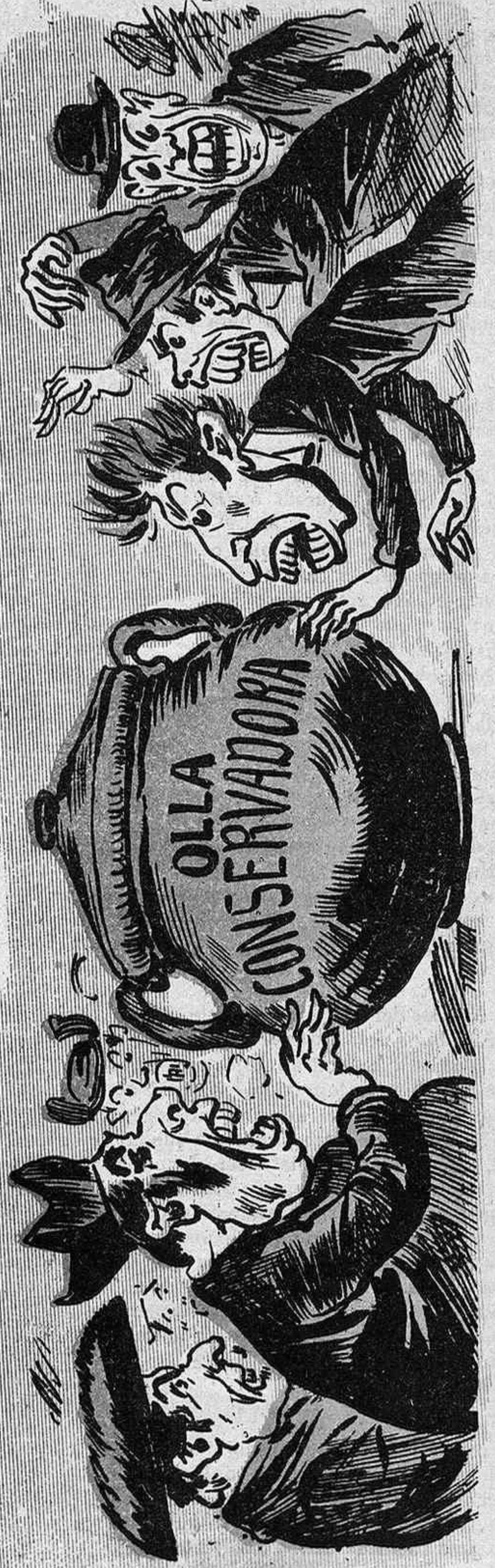
¡Au, golafres! ja hos espera l' cyna de la fartanera