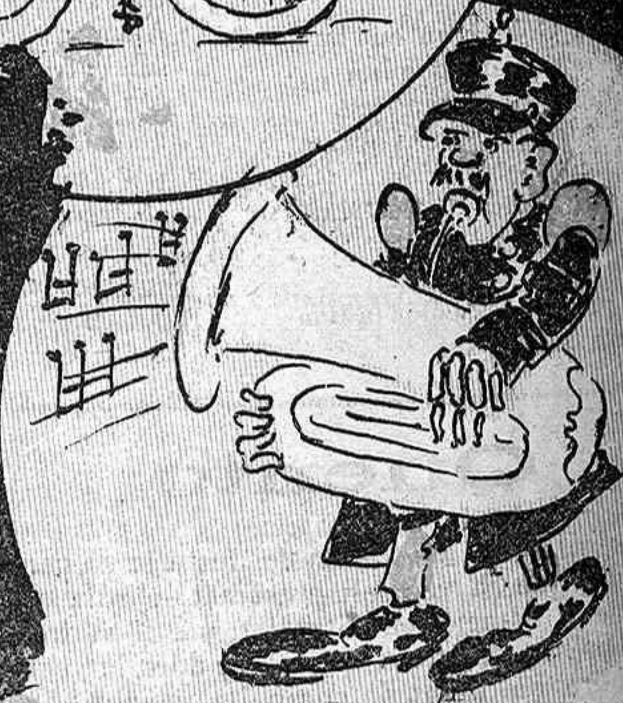
Los infants van divertir-se, tots van riure y van gosar, menos aquét y altres pobres qu' estavan tips de sonar.