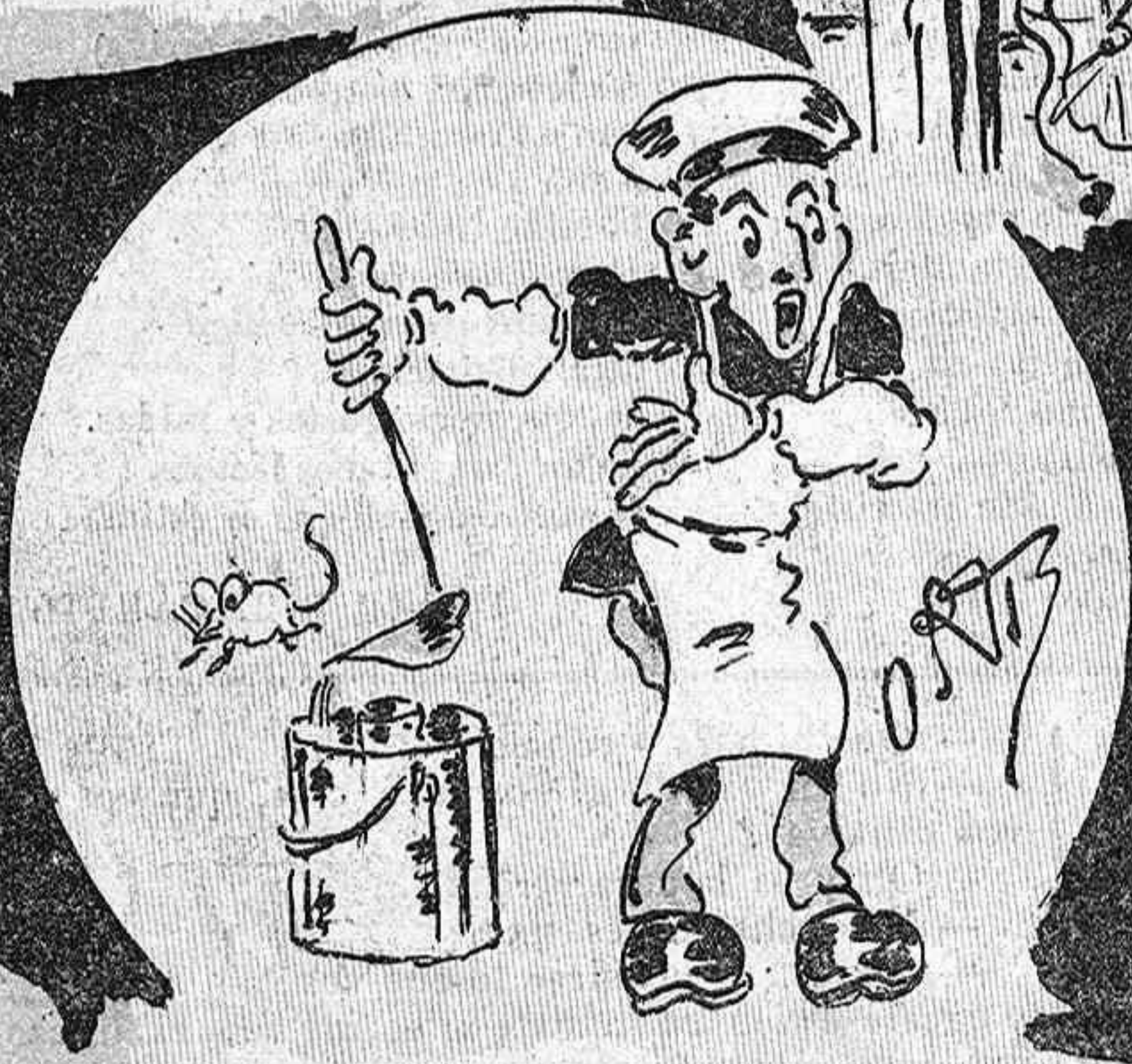
Ranxo suculent, diví, fet ab such de ratoi.