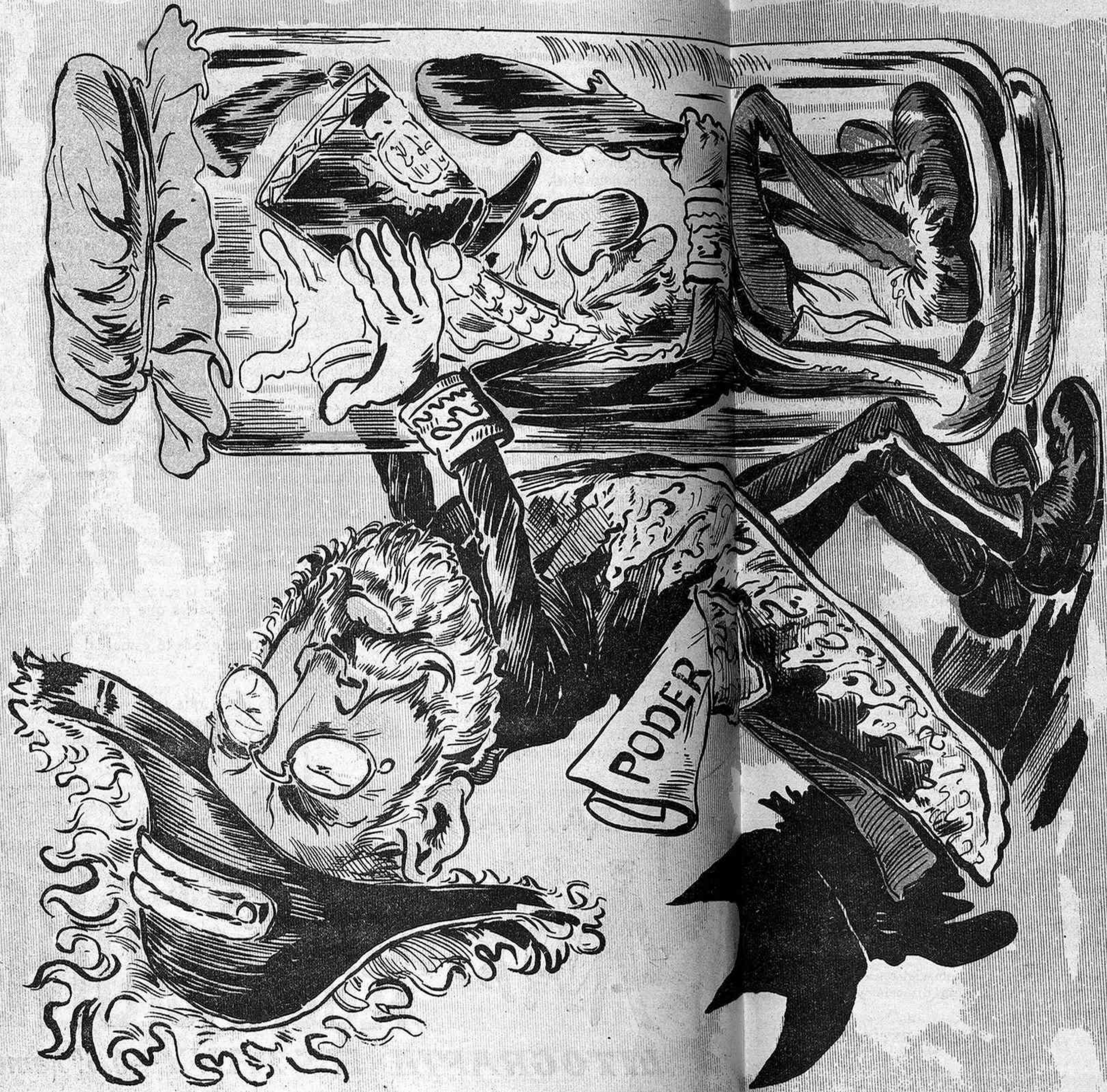
- Vaja mestre, ja n'hi ha prou; y en obsequi a ta persona t' enviaré a l' Art Antich del Parque de Barcelona .