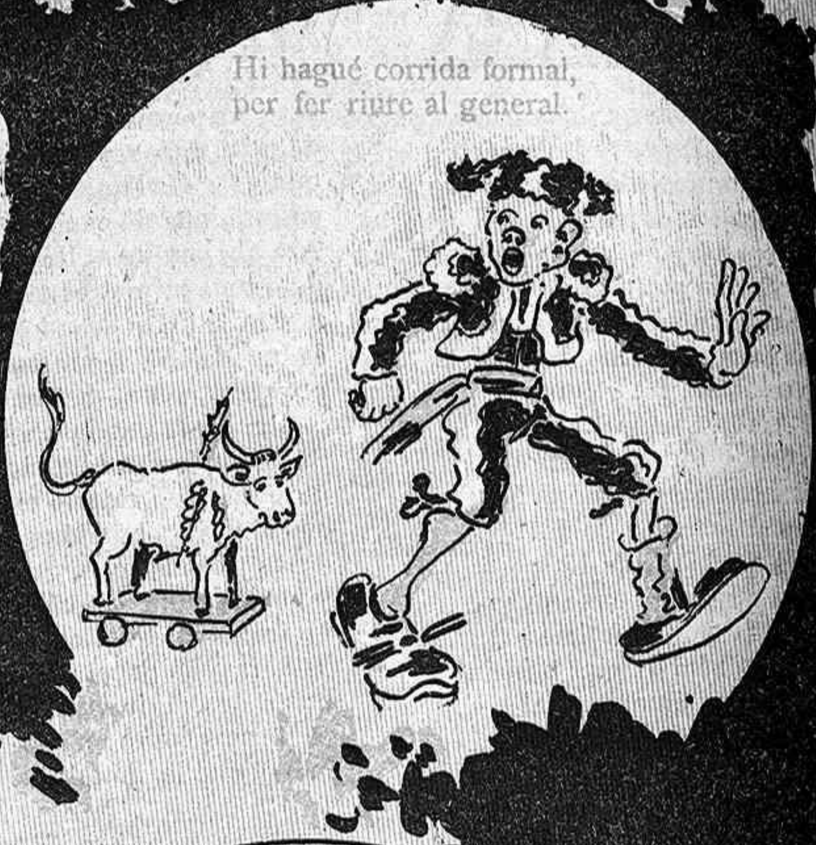
Hi hagué corrida formal, per fer riure al general.

PROGRAMA DIANA CORRIDA DE TOROS!! CARRERAS DE BICICLETA RANCHOS EXTRAORDI- NARIOS CONCIERTOS BAILES