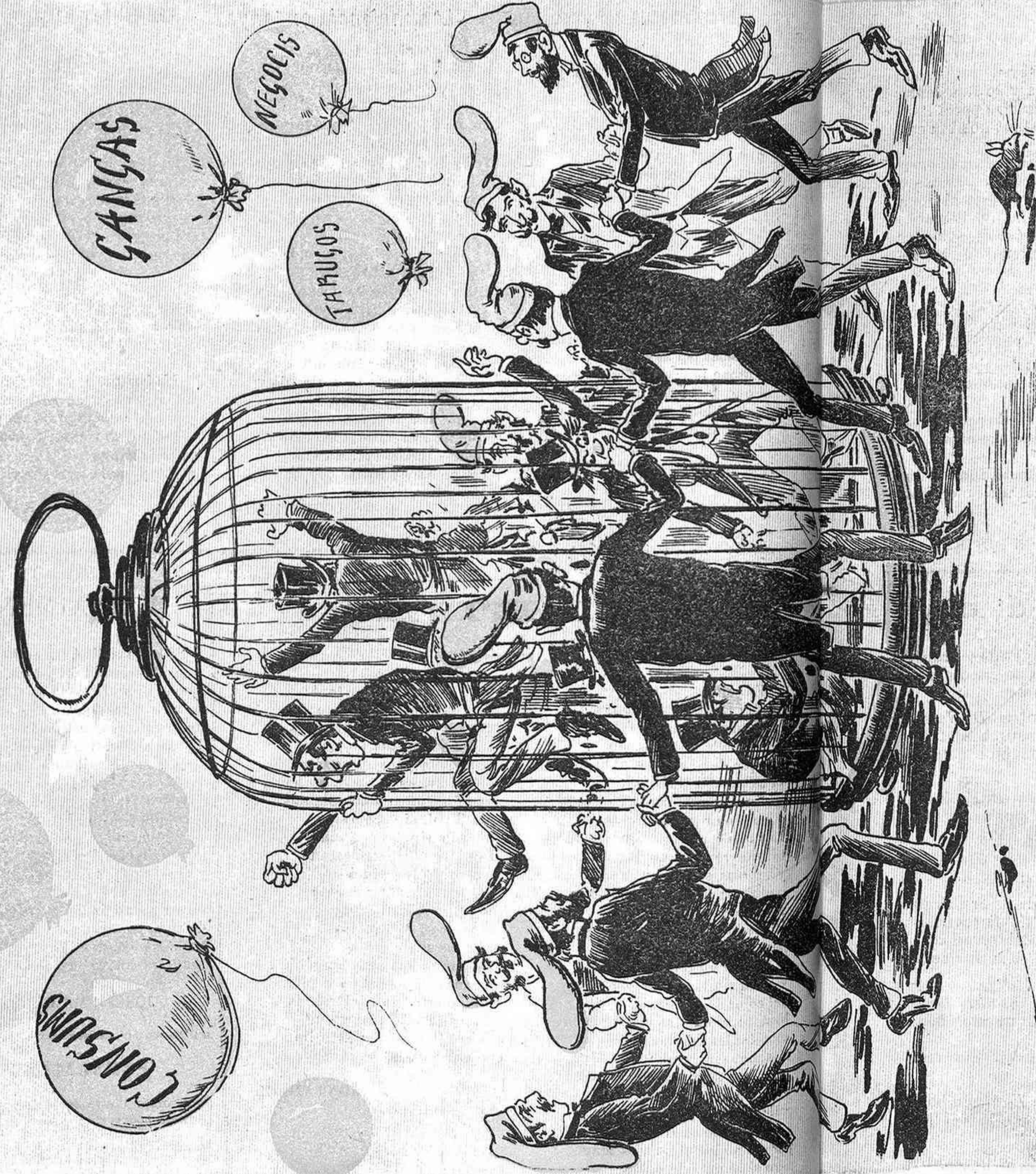
Enfatsismats, plens de rabia, sis n' hi han dins d' una gabia qu' es diu «Comissió Central» del Cuerpo municipal.