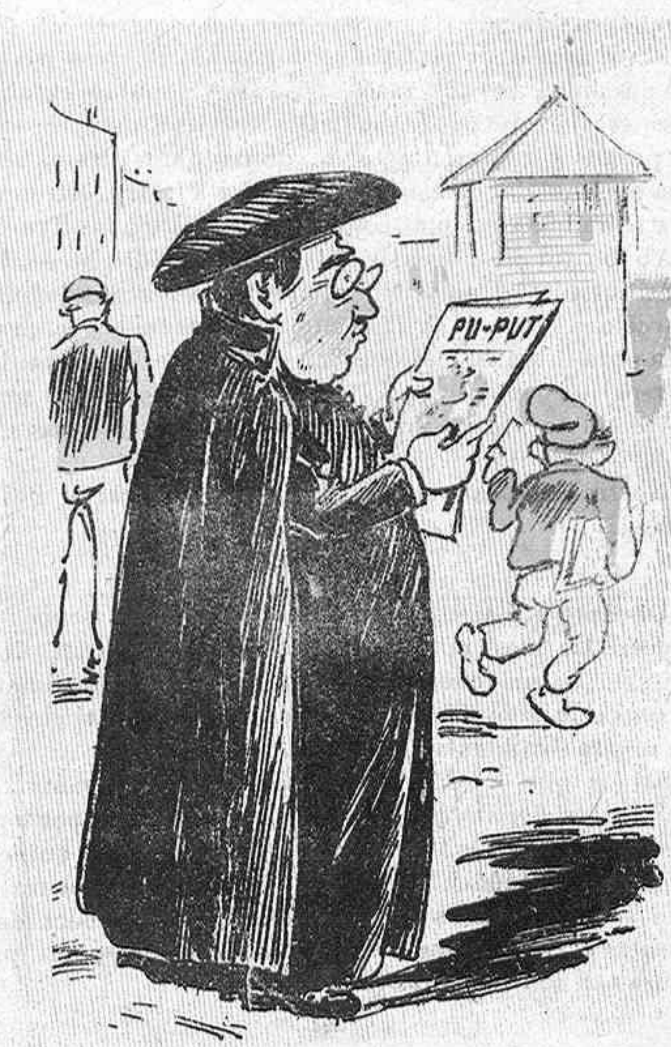
Un comprador del tercer número del Puput.