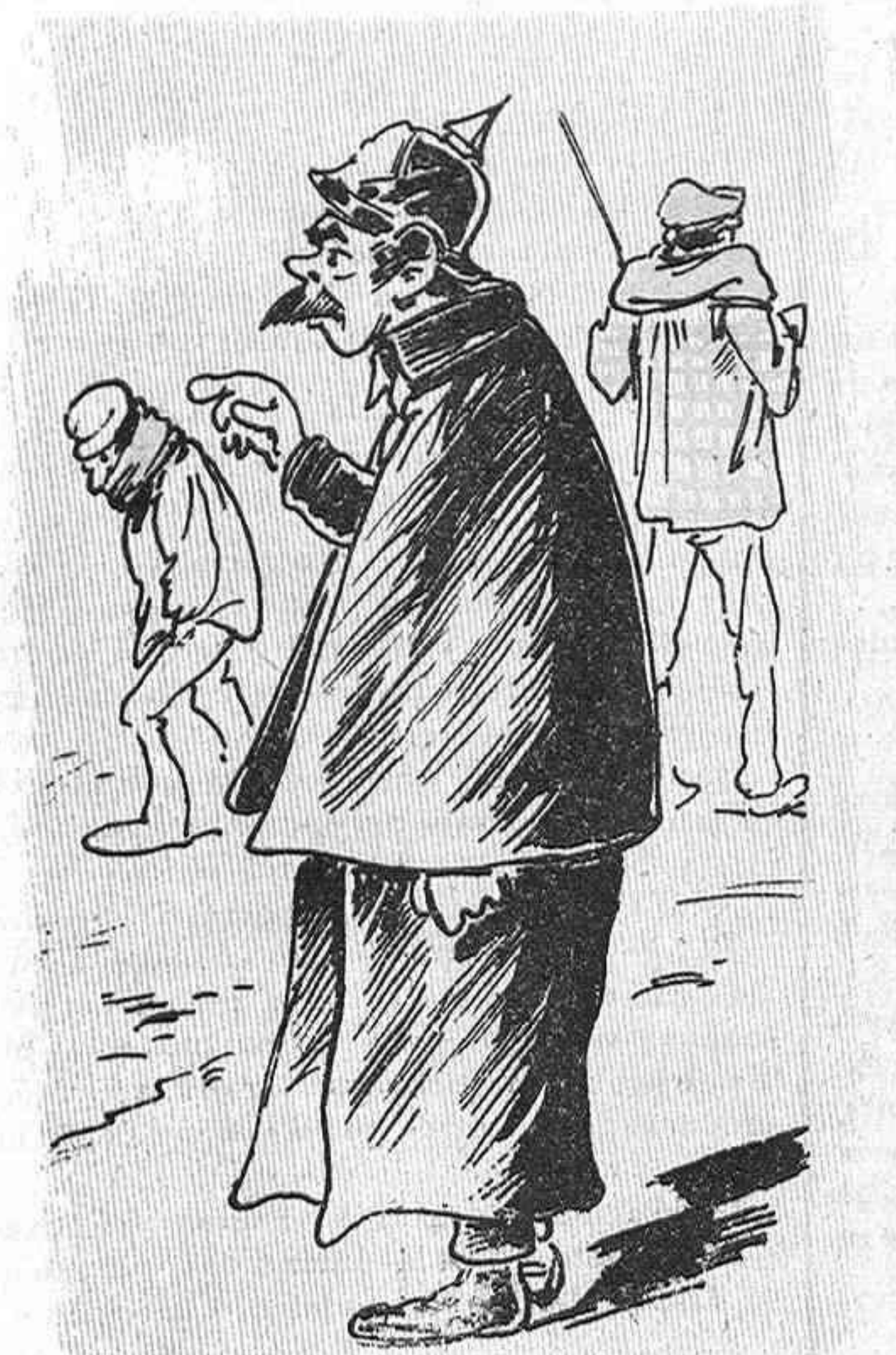
— Me parece que á ese rechidor nou que le llamen Don Narciso Buchó yo de he visto otras veces en la Casa gran