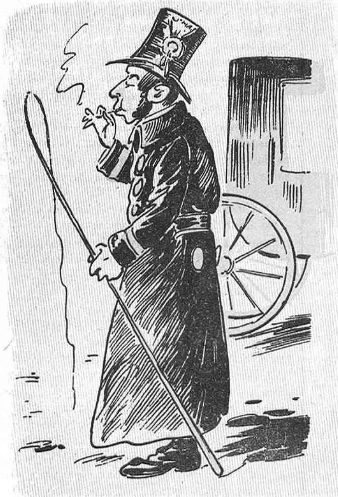
Ahir, puros esquisits: avuy... un escanya-pits.