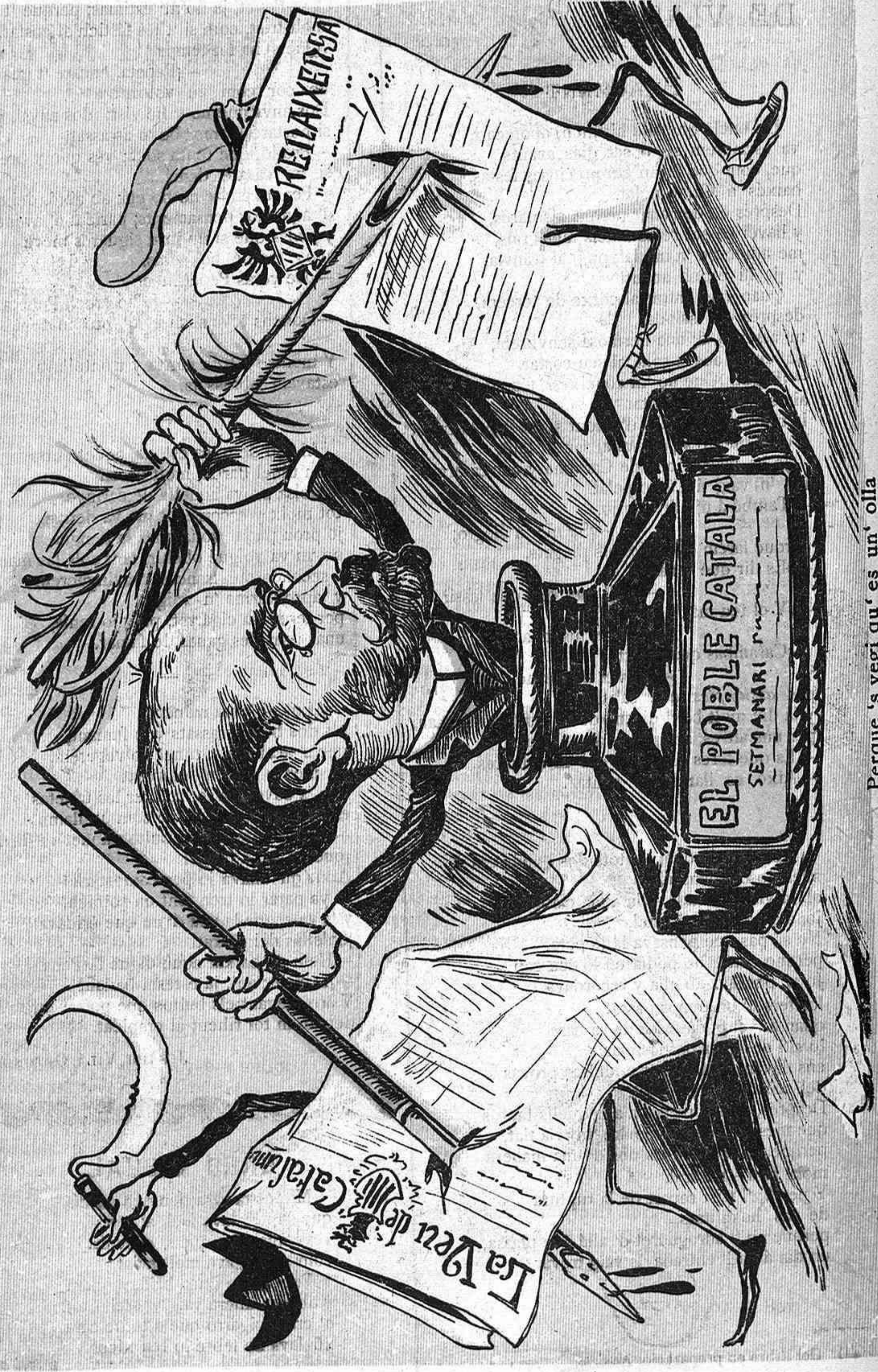
Perque 's vegi qu' es un' olla la Unió y els de La Veu, en Suñol escampa tinta en defensa del Progrés.