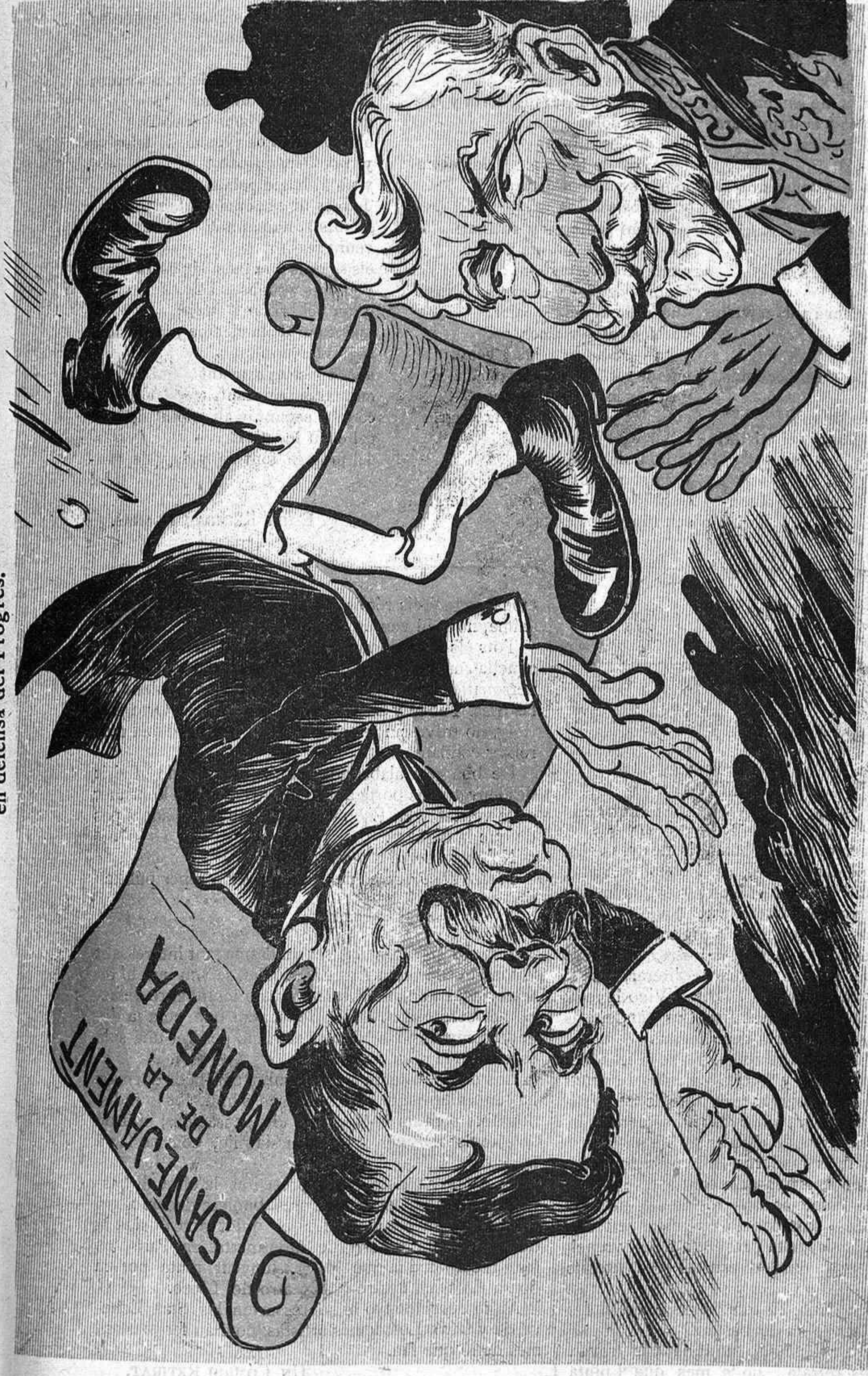
Ab molt dissimulo en Mauia ha lograt que 'l Parlament tombés a n' en Vilaverda y alló del sanejament.