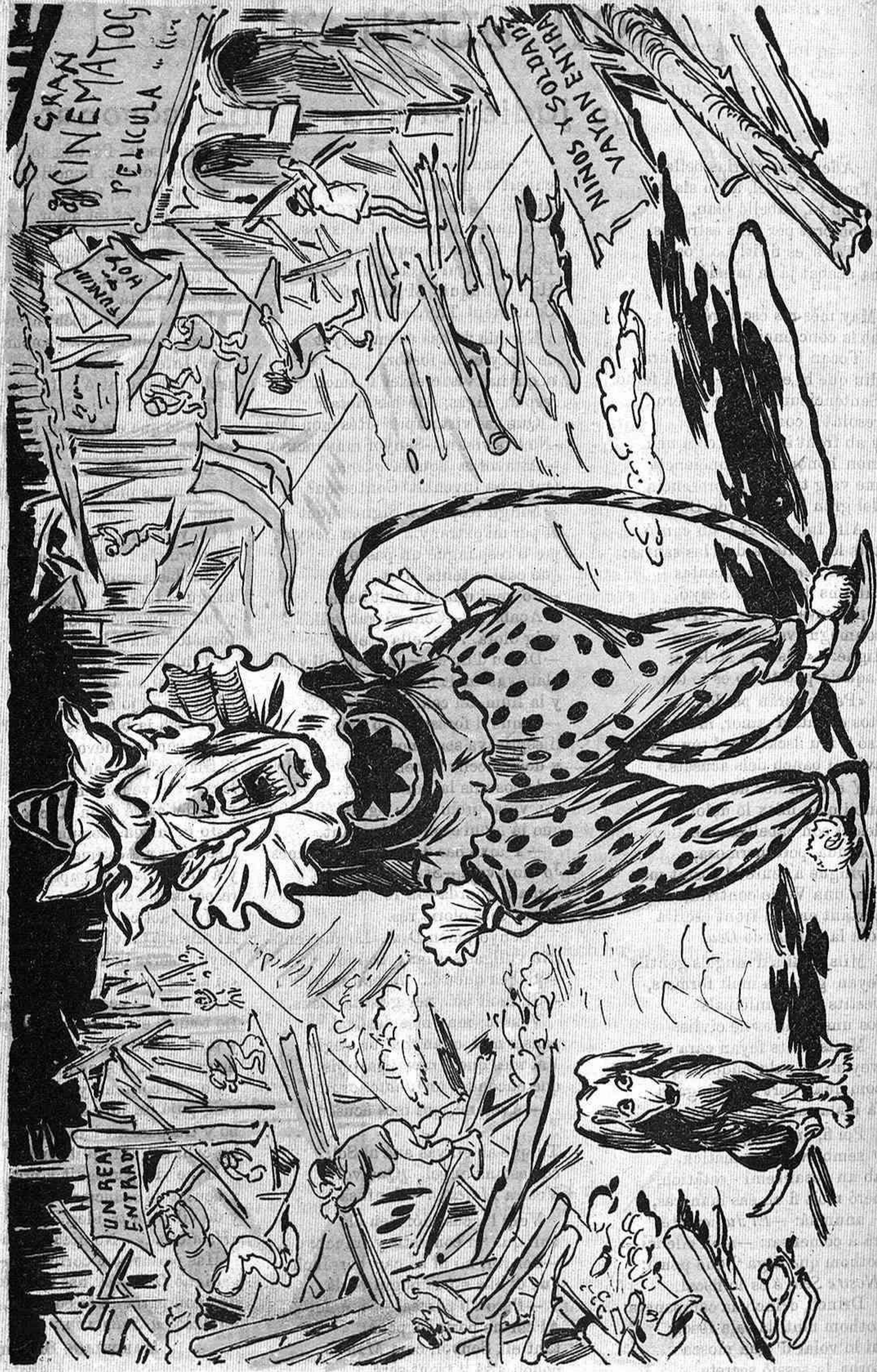
Dels Guinyols del Paralelo ja no s'ha queda ni una palla... si s'ha palla s'ha mor de fam ¿ab qui rirà la canalla?