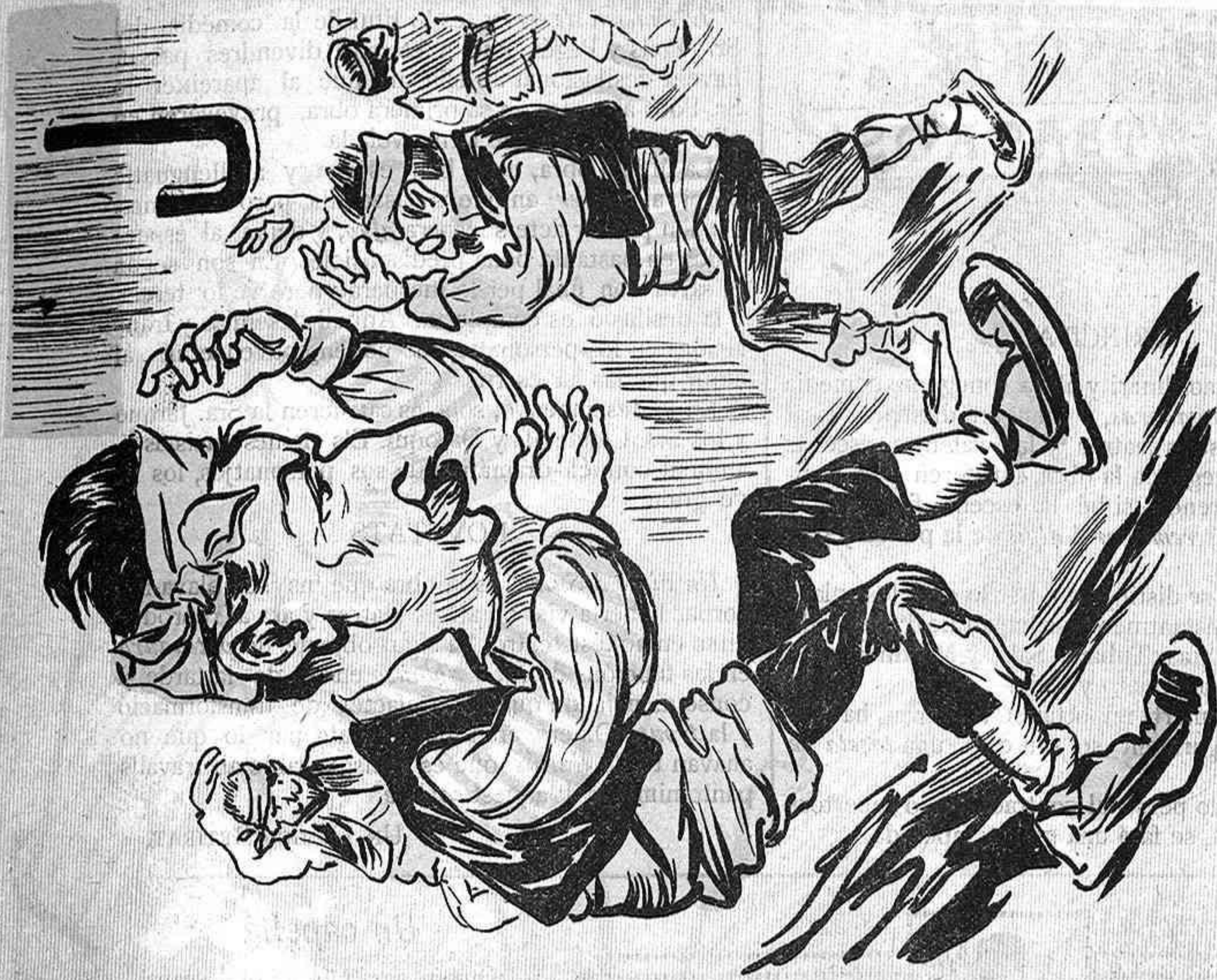
¡Apa maños divertius y balléu com uns baturros; nosaltres, pels regidors ja pasarem los apuros.