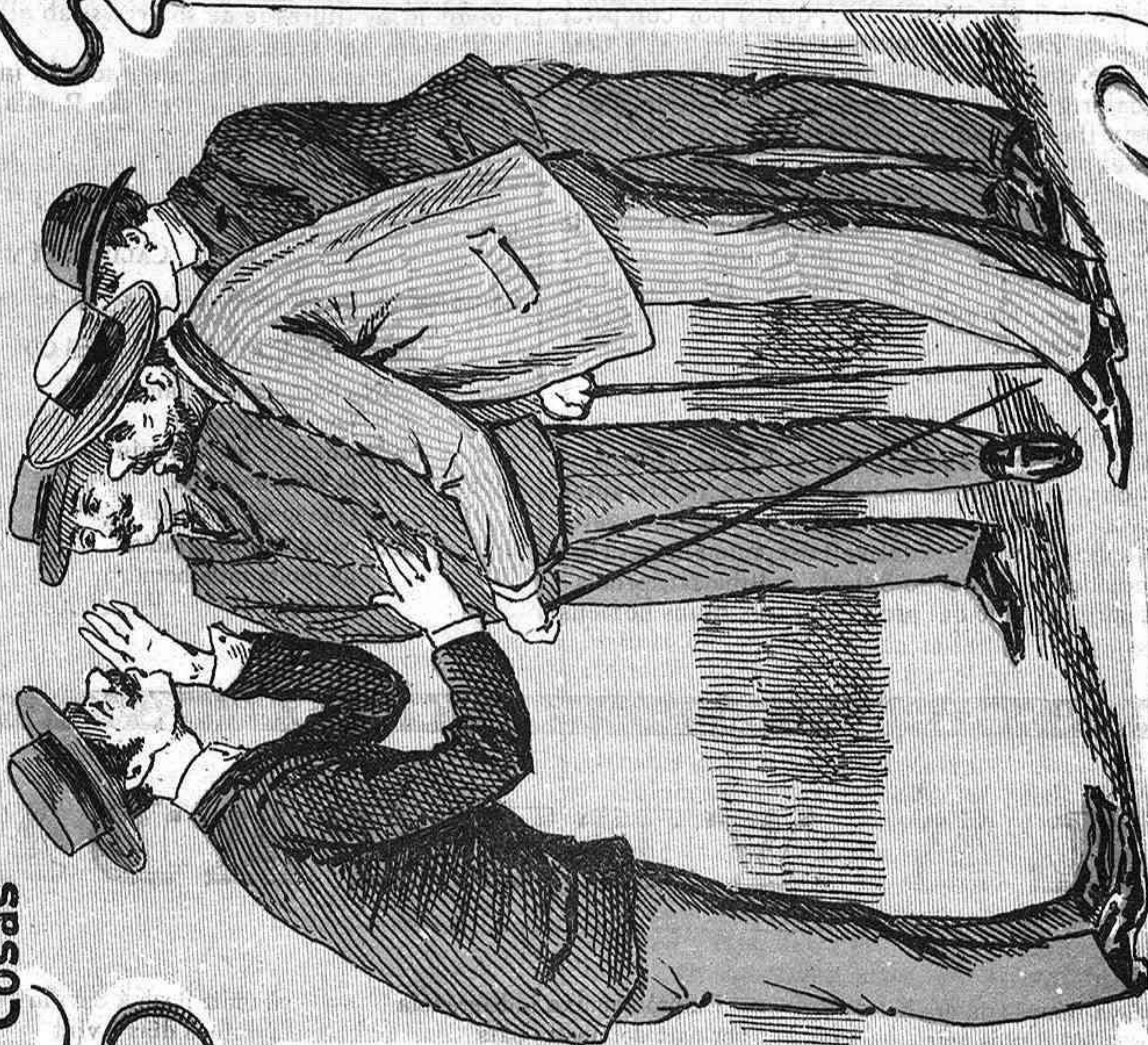
—Jo ja li he dit á l' Aurigemma, si no dona aquell tant per cent als pobres no li pago la factura, porque quan se tracta de pagar soch tan pobre com un altre.