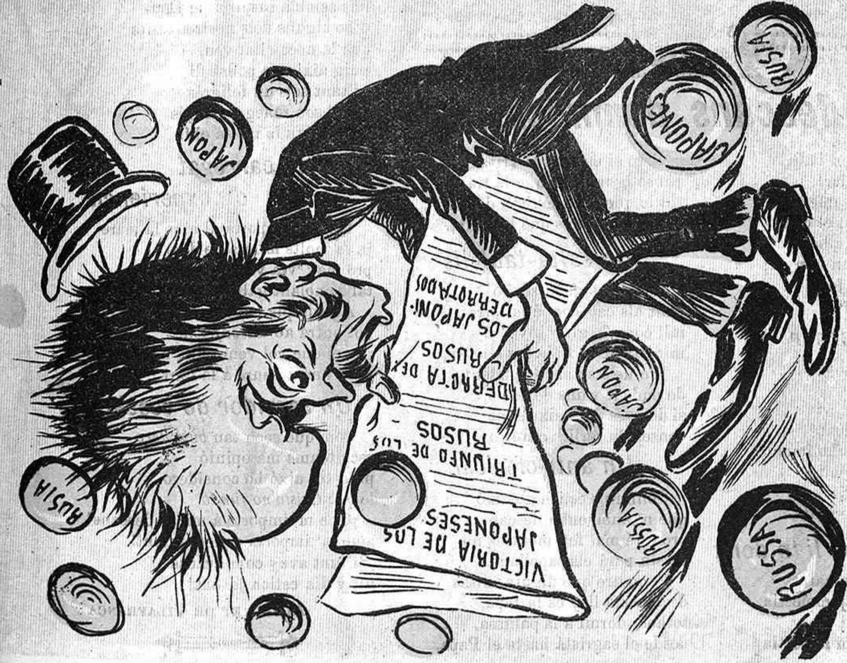
A dalt guanyan al Japó abaix diu que son els russos y las bolas van rodant ¡y no guanyém prou per sustos!