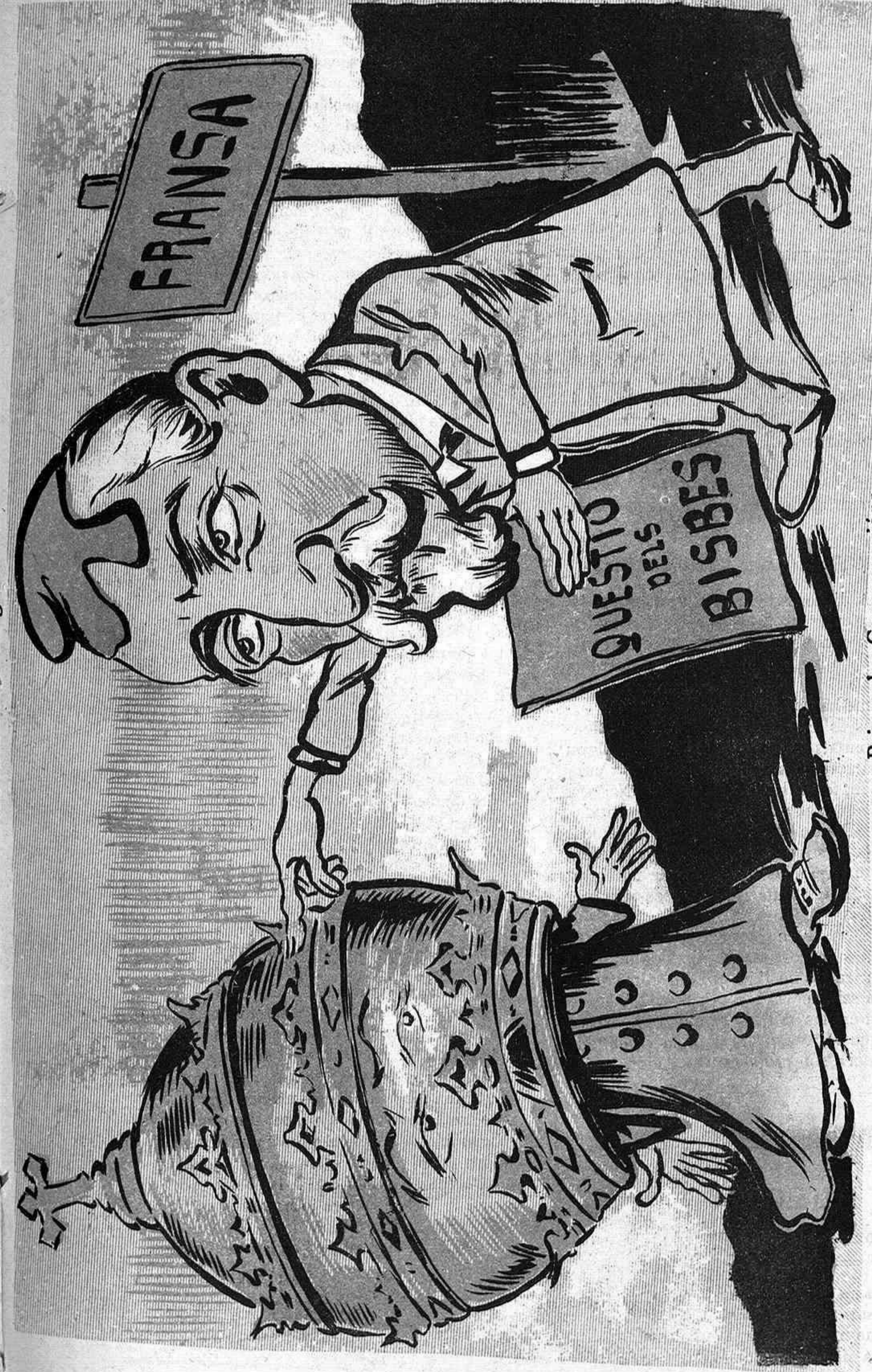
Primer las Congregacions are també el Vaticà: per sempre més será en Combes el papu dels clericals.