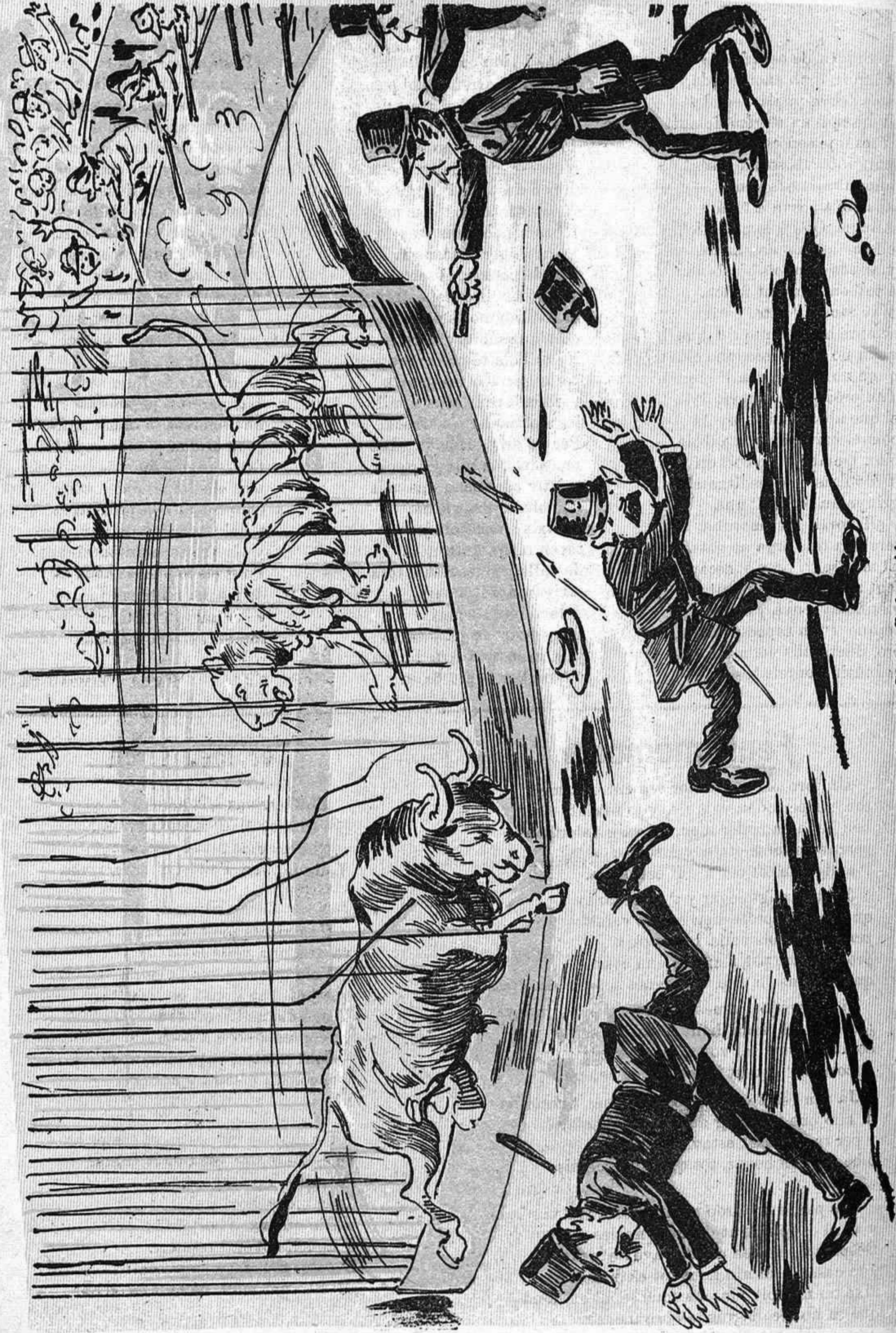
Lo de Sant Sebastián es exemple contudent per demostrarnos qu'en Maura ens encamina al Progrés