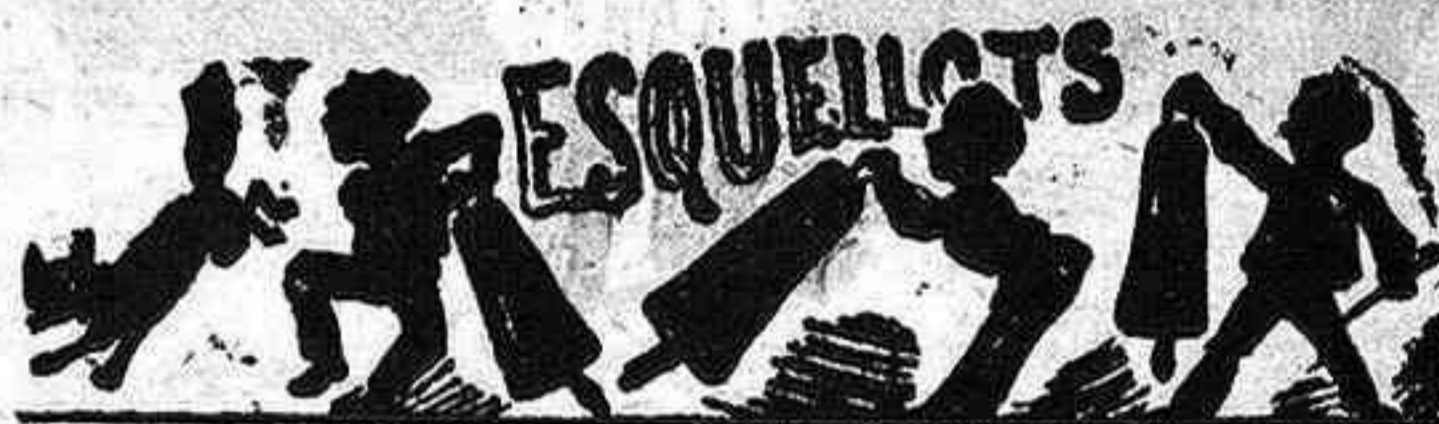
L'último visita de la Reyna regent á la Exposició universal va distingirse per un gran escandole.