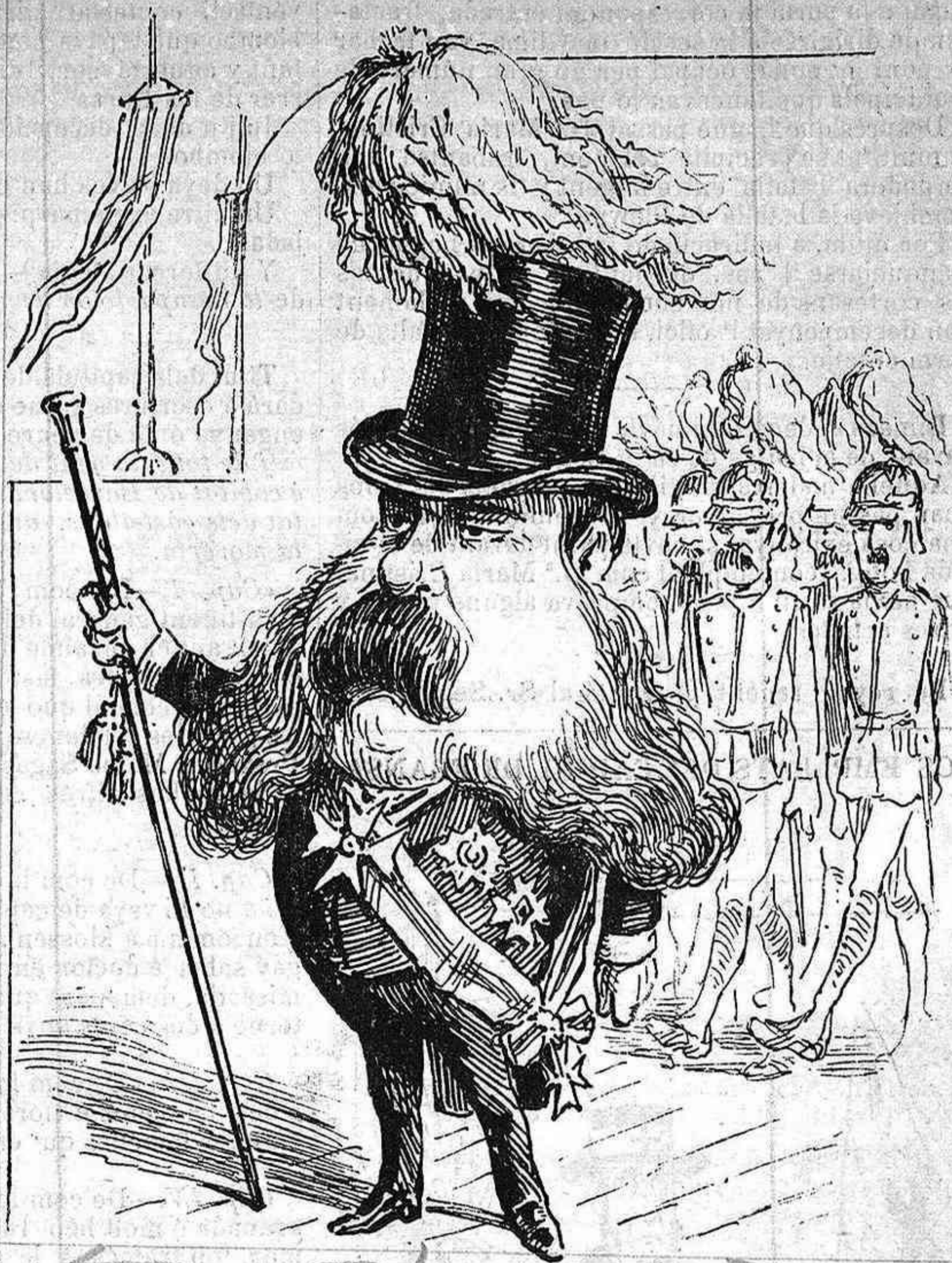
Fins ara anava á remolque de las personas reals; pero ara qu' es sol... ¡es rey dels Xanxas municipals!

No 'm diguis calumniador que aixís sortida no trobas, per afirmar tho tinch probas y callant te faig favor.