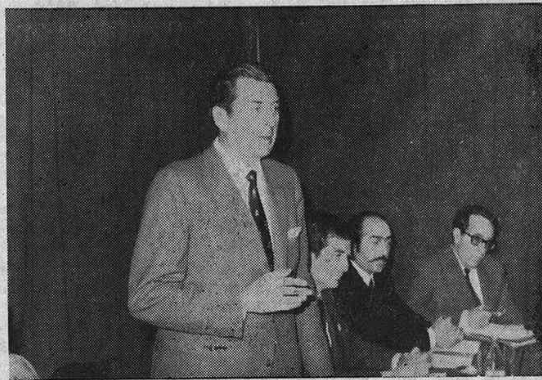
EL SR. ALLENDE, DURANTE SU DISCURSO.

Afirmó que el Gobierno tiene conciencia del estado actual de la Seguridad Social en el campo, y que se trabaja en la elaboración de la norma adecuada. Dijo que el sistema actual de cuotas no es el más (pasa a la página 10)